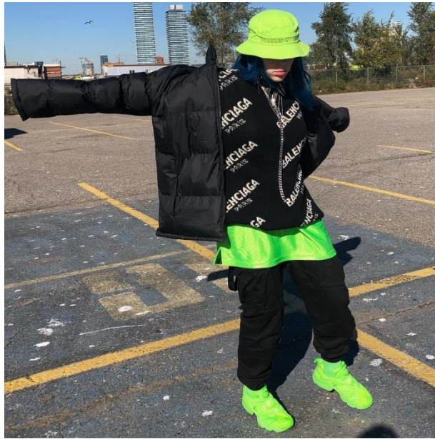
Рис. 2.2. Мішкуватий стиль одягу Біллі Айліш

Айліш часто виражає своє ставлення до моди як до щось вторинного, що не повинно визначати її індивідуальність. Вона публічно відмовляється від стандартів краси і моди, що робить її постать значущою для багатьох молодих людей, які прагнуть бути собою без огляду на суспільні норми. Відсутність інтересу до моди стає частиною її публічного образу, в якому свобода вибору і самовираження є основними цінностями.