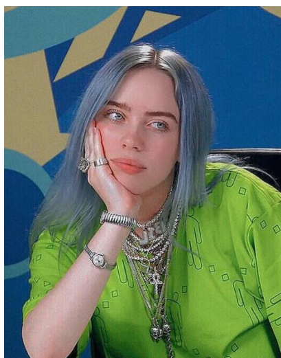
Рис. 2.3. Бірюзове волосся Біллі Айліш на початку кар'єри

Зокрема, бірюзовий колір волосся, який Біллі носила на початку своєї кар'єри (жив рис. 2.3.), став її візитівкою і символом нового покоління артистів, що прагнуть відмовитися від традиційних стандартів краси. Пізніше вона переходить до більш натуральних відтінків, таких як блондин, але навіть у цих змінах зберігає свою індивідуальність. Зміна кольору волосся є частиною її методу візуального самовираження, що дозволяє їй постійно оновлювати свій імідж і підтримувати цікавість публіки.