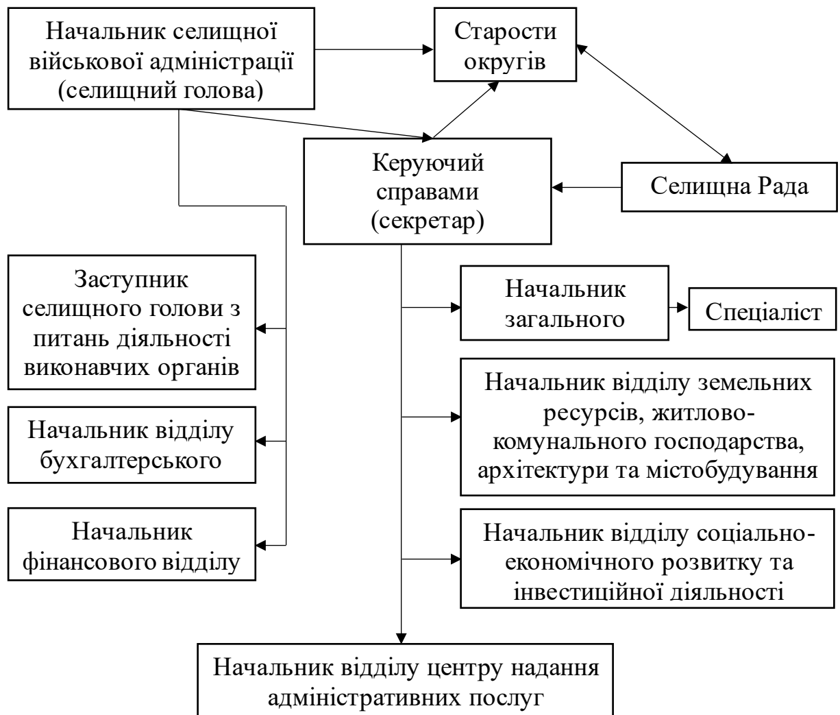
Рисунок 2.2. Структура типової територіальної громади на основі сформованих пропозицій удосконалення управління територіальною громадою

Виходячи із запропонованих змін та взявши за основу організаційну структуру Старосалтівської селищної громади, як типову та характерну для більшості подібних ОТГ, то матимемо наступну типову організаційну структуру зображену на Рис. 2.2: