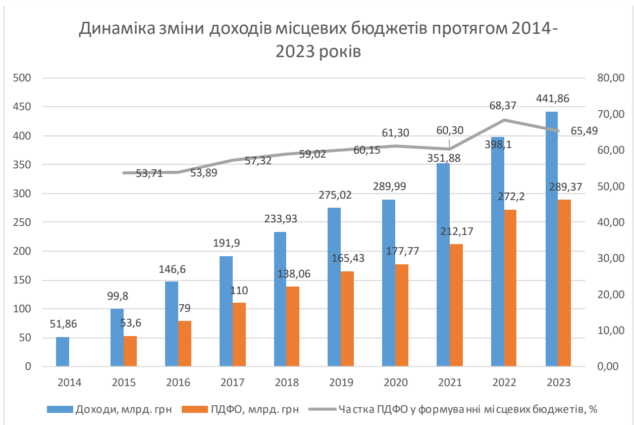
Рисунок 1.3. Динаміка зміни доходів місцевих бюджетів протягом 2014-2023 років, млрд. грн., без врахування трансфертів

Згадана реформа Децентралізації, має позитивний вплив на економічний розвиток громад, який, в свою чергу, позитивно вплинув на добробут їх населення та країни в цілому, завдяки суттєвому зростанню фінансової спроможності громад до реалізації конкретних проектів та функції через зростання доходів місцевих бюджетів після початку реформи, що зображено нами на рис 1.3.