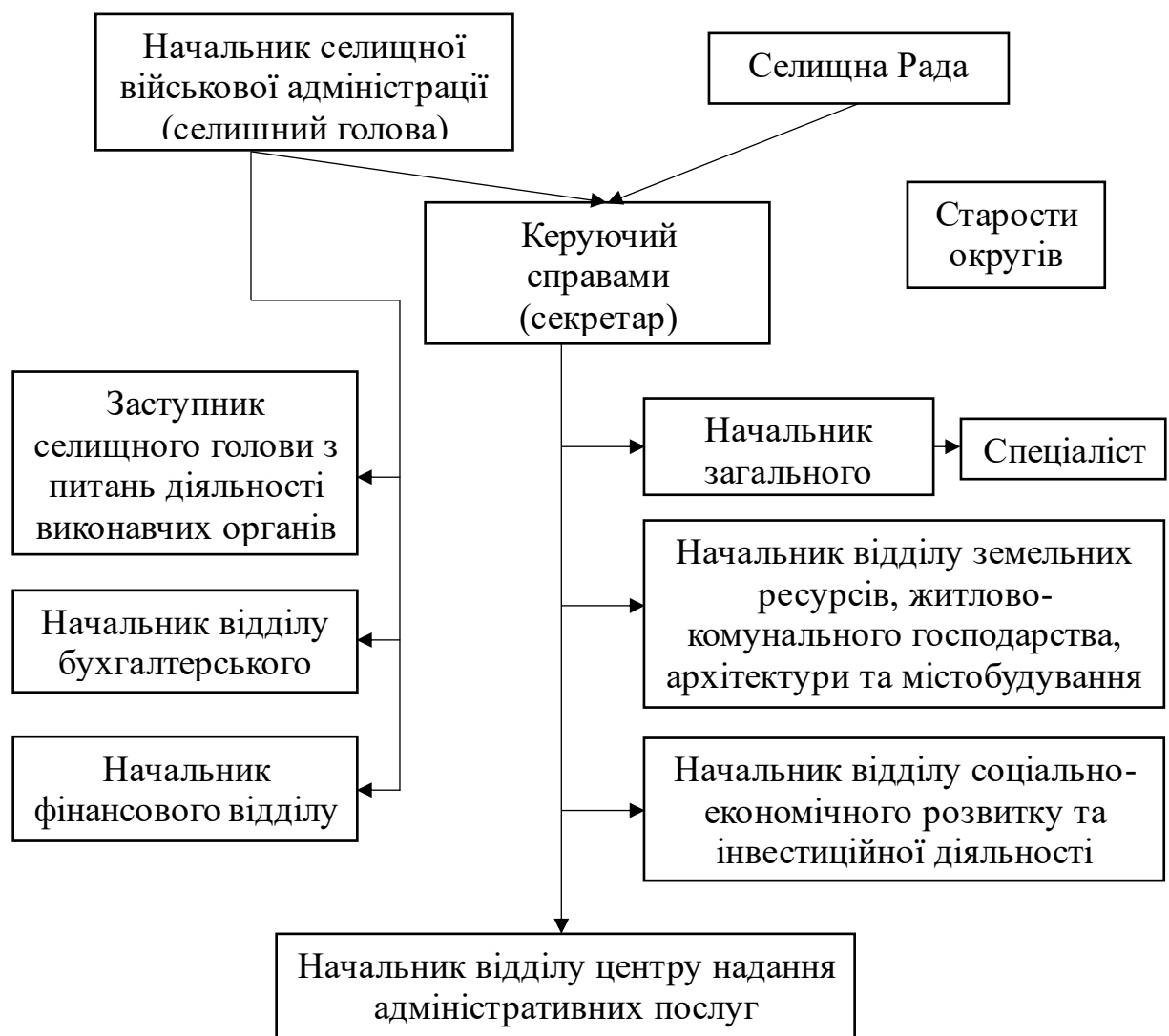
Рисунок 1.2. Структура Старосалтівської селищної територіальної громади

Приклад структури ОТГ можемо проілюструвати прикладом утвореної в 2015 році Старосалтівської селищної територіальної громади на рис. 1.2., який було складено завдяки використанню публічно доступної інформації на офіційному сайті громаді, що говорить про певну ступінь її відкритості.