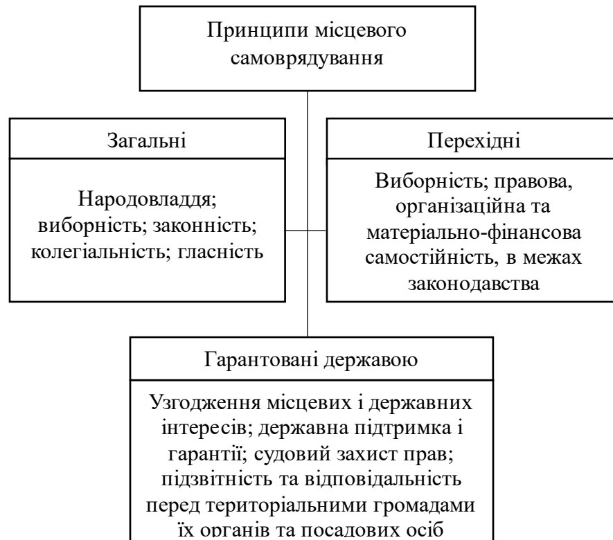
Рисунок 1.1. Схема групування принципів місцевого самоврядування

межах законодавства; підзвітність та відповідальність перед територіальними громадами їх органів та посадових осіб; державна підтримка та гарантії; судовий захист прав [1]. Усі ці принципи можуть бути умовно згруповані засновуючись на їх «природності» та ступеню участі держави в їхньому гарантуванні, що зобразимо на рис. 1.1.