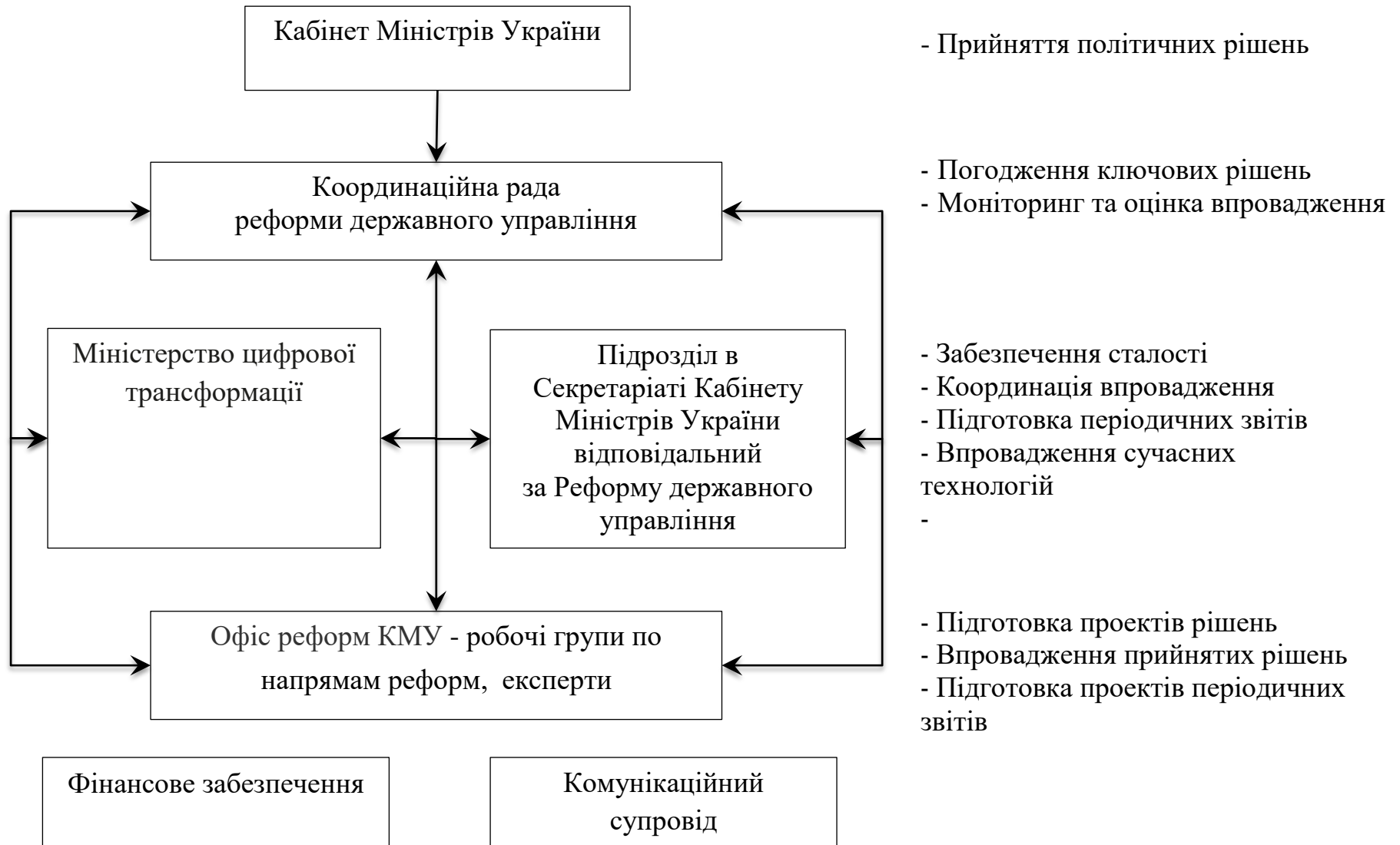
Рисунок 2.1 – Апарат реформування публічного адміністрування