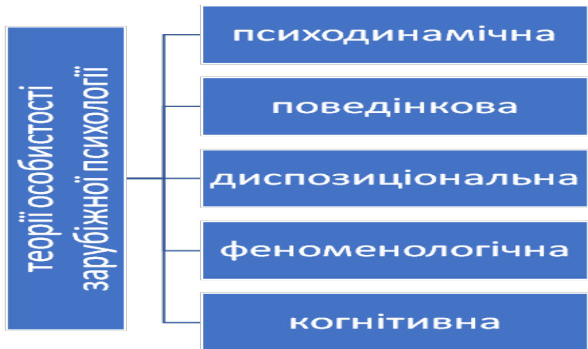
Рисунок 1.1. Теорії особистості представлені зарубіжною психологією

Особистість – це складне поняття, яке включає своєрідні характеристики, риси та властивості людини. Визначення її особистого способу життя, способу сприйняття світу та її реакції на зовнішні події та стосунки. На формування та розвиток особистості протягом життя впливає багато факторів, наприклад генетичні фактори, передача, виховання, соціокультурне середовище, навчання, досвід і взаємодія з іншими. Аспекти, які включає особистість наведені на рисунку 1.2.