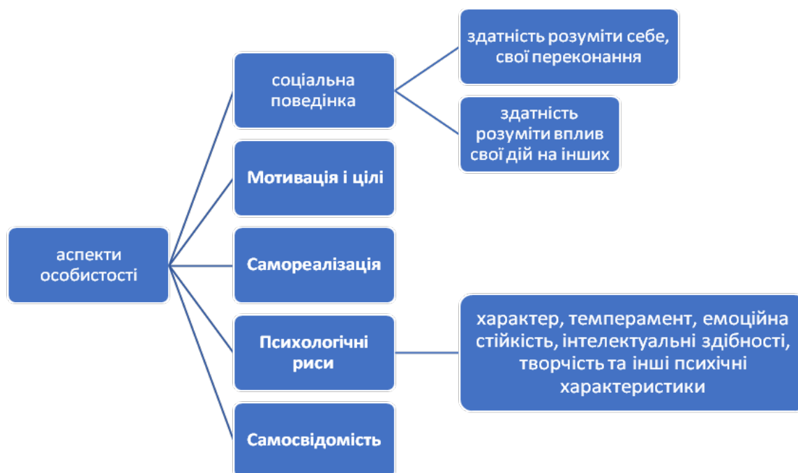
Рисунок 1.2. Аспекти особистості

великих півкуль), які визначають психофізіологічні функції та структуру органічних потреб.