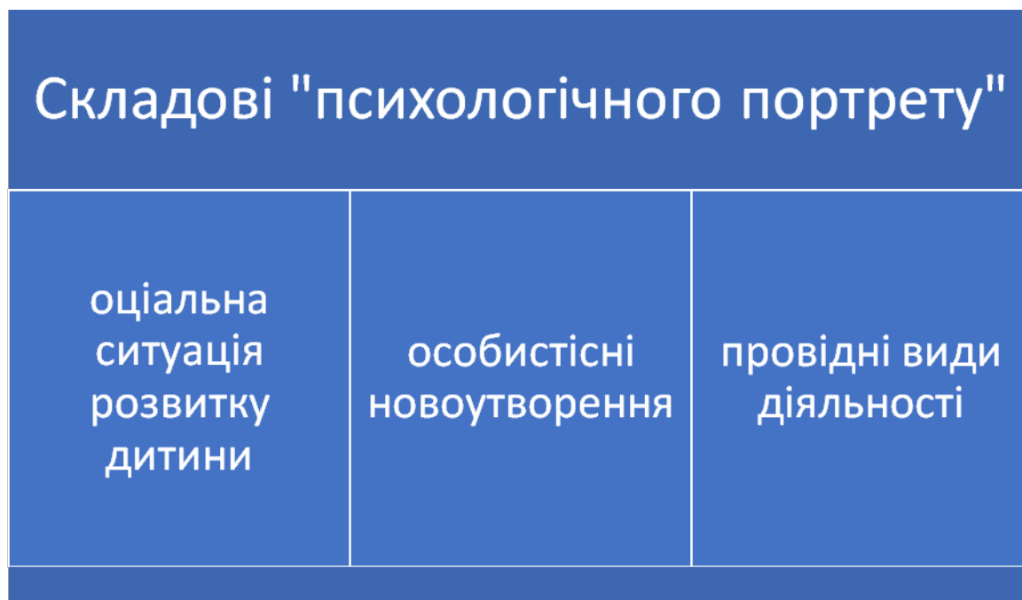
Рисунок 1.5. Взаємопов'язані складові психологічного портрету

– молодший підлітковий вік, 15–17 років – середній підлітковий вік, від 17 років – старший підлітковий вік. В основі класифікації вікових періодів лежать певні закономірності розвитку дитини, знання яких і розкривають особливості того чи іншого віку. Складемо та ведемо складові психологічного портрету, рисунок 1.5.