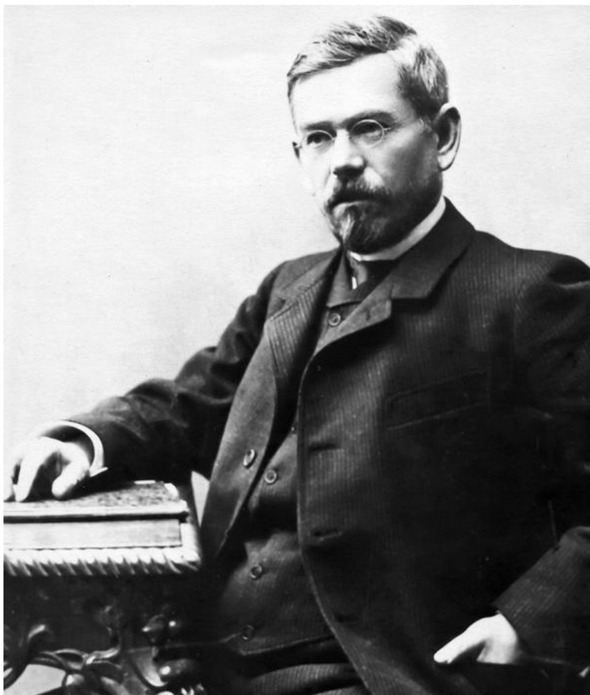
Фото 3. Д.І.Багалій.