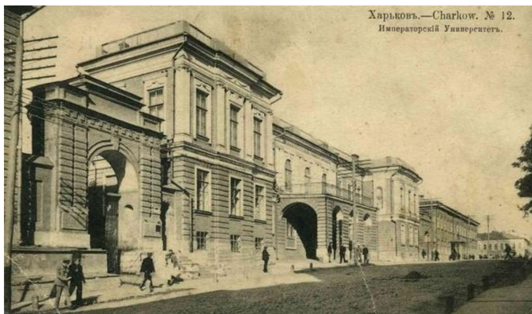
Фото 2. Листівка. Харківський університет.