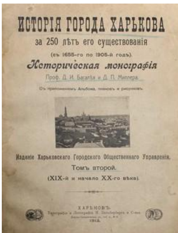
Фото 5. Фундаментальна праця Д.І.Багалія «Історія города Харкова за 250 років його існування».