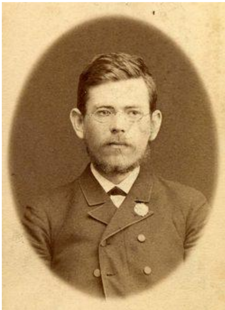
Фото 1. Д.І.Багалій на початку кар'єри.