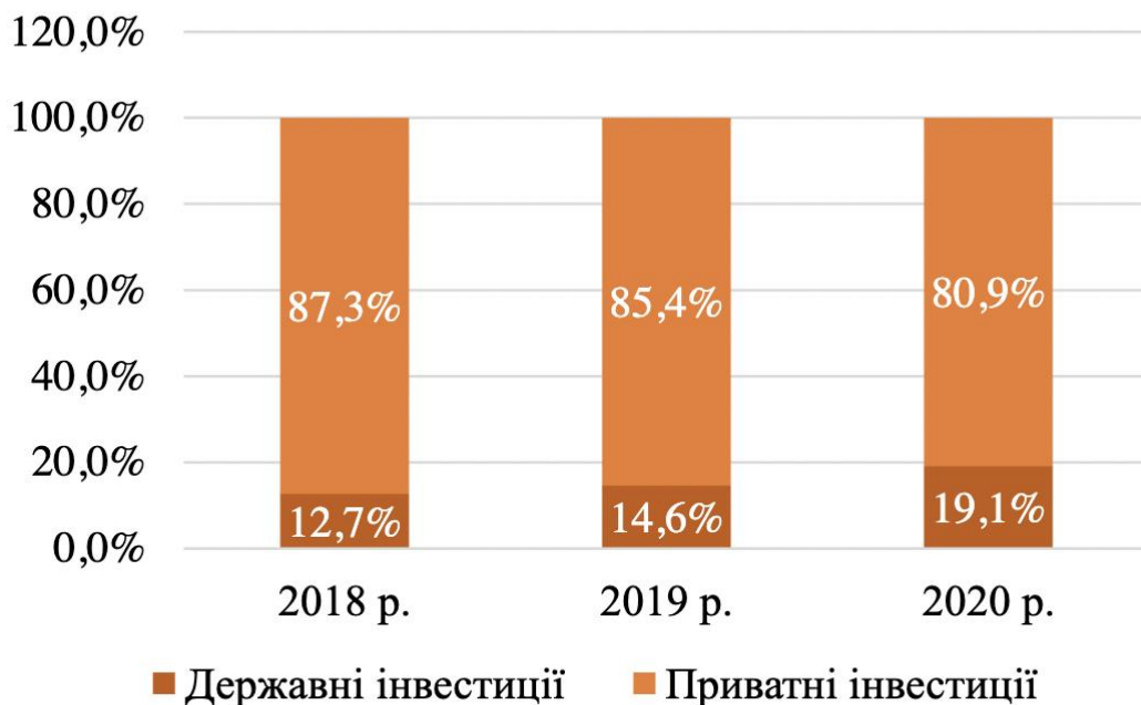
Рис. 2.1. Валовий приріст основного капіталу в Україні (% від загальної суми) [74]

Для кращого розуміння майбутніх перспектив, розглянемо стан інвестиційної активності в Україні до війни. В період з 2018 по 2020 роки, загальний обсяг інвестицій в економіку країни, відповідно до міжнародних стандартів, був відносно низьким, причому переважали приватні інвестиції. У 2018 та 2019 роках цей показник (валовий приріст основного капіталу) склав 17,6% ВВП, але в 2020 році знизився до 13%. Таке падіння у 2020 році можна вважати наслідком економічного спаду через пандемію COVID та зменшення інвесторської довіри. В аналізований період роль державних інвестицій збільшувалась щорічно: з 12,7% від загального обсягу інвестицій у 2018 році до 19,1% у 2020 році [62] (рис. 2.1).