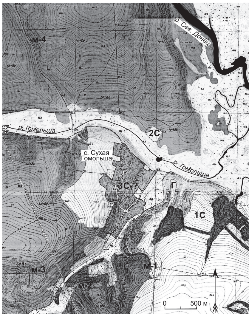
Рис. 1. Топокарта с расположением известных салтовских памятников в Сухой Гомольше Условные обозначения: Г – городище, С – селище, м – могилиник

на упоминание В. К. Михеевым еще одного могилиника: «...грунтовой могилиник VIII—X вв. с обрядом трупосожжения на южной окраине села» [2, с. 6]. Рубеж XX—XXI ст. ознаменовался интенсивными несанкционированными поисковыми работами, чему способствовало появление в свободном доступе металлодетекторов и практически полное отсутствие памятникоохранной