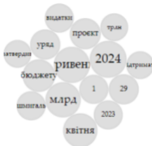
Рисунок 3.4 – Мапа тексту