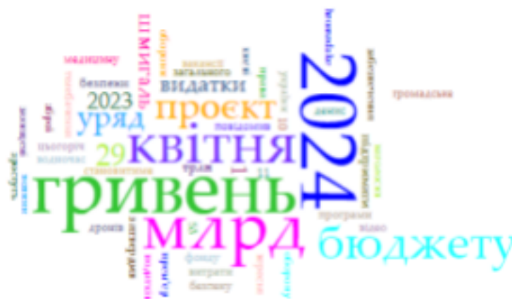
Рисунок 3.3 – Частотна мапа

Аналіз тону та емоційної насиченості матеріалу: згідно з проведеним аналізом, тон та емоційна насиченість матеріалу у публікації були переважно нейтральними. Інформація подана у формі офіційного повідомлення, без виразних загострень чи емоційних висловлювань. Такий підхід відповідає стандартам об'єктивної журналістики та не містить суб'єктивних оцінок. Публікація демонструє, що під впливом інформаційної війни видання стали акцентувати увагу на питаннях оборони, безпеки, соціальної підтримки та економічного розвитку.