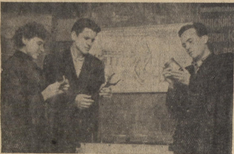
На заняттях автогуртка