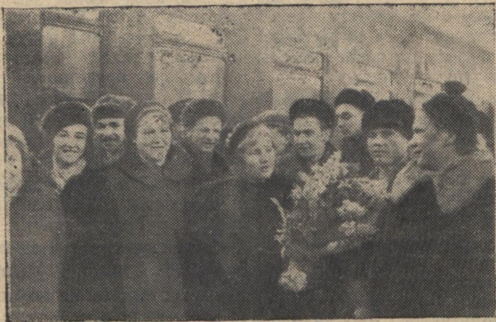
Група московських спортсменів на вокзалі

Під час зимових канікул цього року до нас у гості приїздили студенти - спортсмени Московського державного університету ім. М. В. Ломоносова.