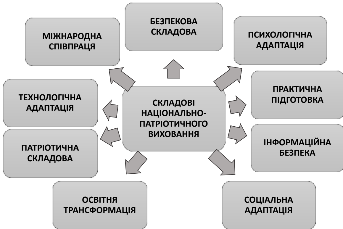
Рис. 1.4. Складові національно-патріотичного виховання (побудовано автором за [21])