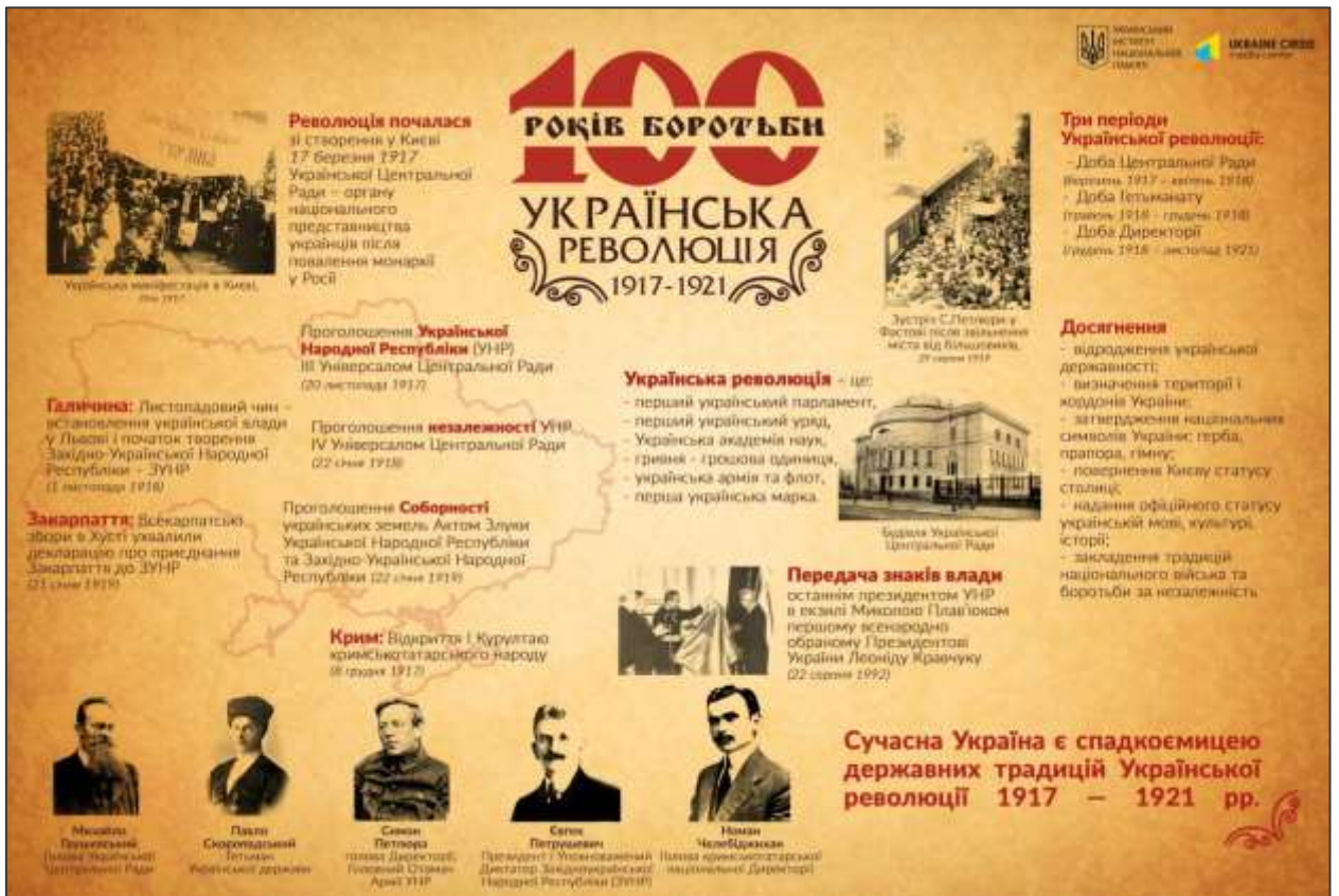
Рис. 1.5. Як творилася держава. Українська революція 1917-1921 років [29]