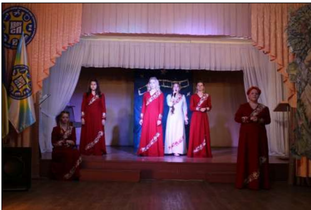
Рис. 3.6 Літературно-музична композиція «Сім струн» Л. Українка (авторська фотографія)

Особливе місце в практиці гурткової роботи займають театралізовані постановки (рис. 3.7) та пластично-хореографічні вистави (рис. 3.8), які дозволяють учням через художні образи, виразні сценічні засоби та сучасні технології розкривати важливі суспільно-політичні та духовно-моральні теми. Такі форми роботи не лише розвивають творчі здібності молоді, а й формують в них критичне мислення, ціннісні орієнтири та активну громадянську позицію.