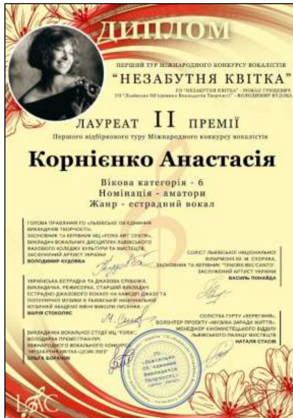
Рис. 3.16. Диплом ІІ премія міжнародного фестивалю-конкурсу «Незабутня квітка»