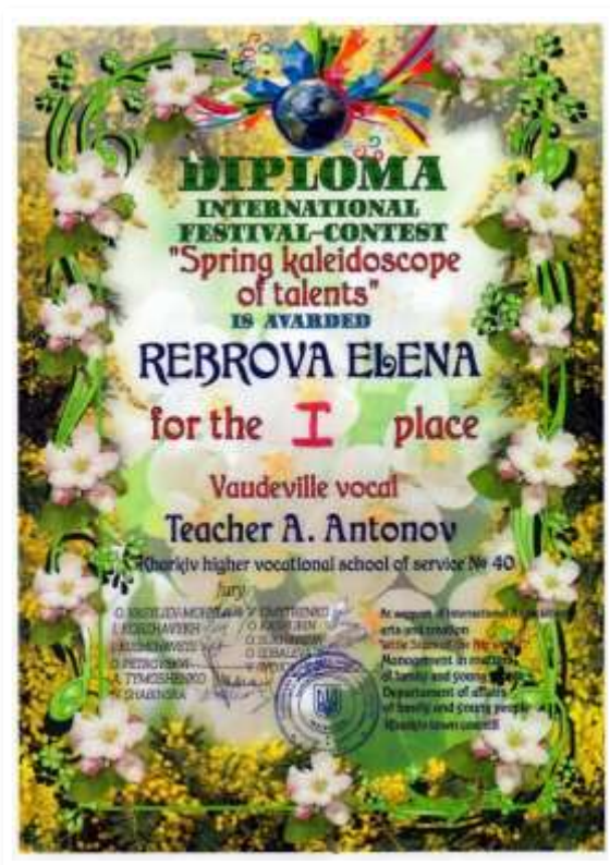
Рис. 3.14. Диплом за 1 місце фестивалю-конкурсу «Весняний калейдоскоп»