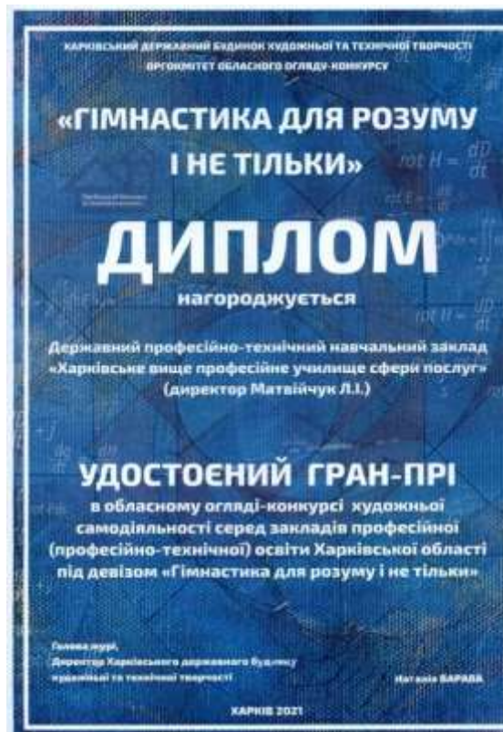
Рис. 3.13. Диплом Гран-прі Обласного огляду-конкурсу «Гімнастика для розуму і не тільки»