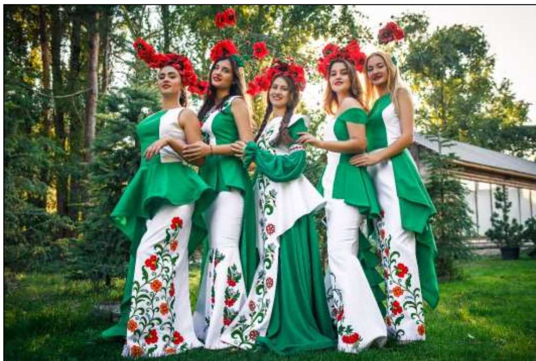
Рис. 3.9. Колекція «Натхненні вірою в Україну!»

особистості. Система заохочування кращих гуртківців, їх публічне відзначення сприяє мотивації учнів до творчості, формує почуття гордості за свої досягнення та належності до навчального закладу.