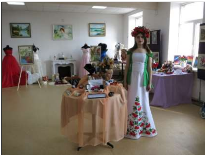
Рис. 3.2. Виставка «Ми працю славимо, що в творчість перейшла»

Наступна виставка називалася «Ми працю славимо, що в творчість перейшла» (рис. 3.2). Вона презентувала творчі досягнення учнів та викладачів училища, демонструвала їх професійну майстерність. На виставці було показано поєднання традиційних технік з сучасними методами роботи, висвітлено розвиток професійної освіти в регіоні та популяризовано робітничі професії серед молоді.