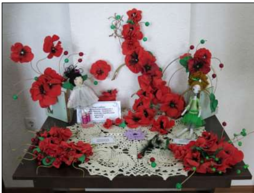
Рис. 3.3. Виставка «Натхненні вірою в Україну!» (авторська фотографія)

Окремою частиною проекту став «Меморіал пам'яті харків'ян, полеглих за єдину Україну» (рис. 3.4).