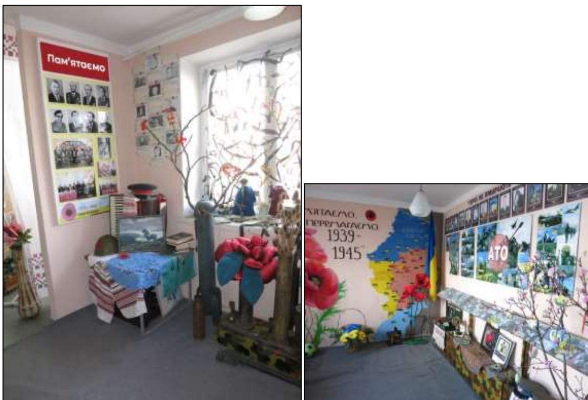
Рис. 3.4. Виставка «Меморіал пам'яті харків'ян, полеглих за єдину Україну»

Окремою частиною проекту став «Меморіал пам'яті харків'ян, полеглих за єдину Україну» (рис. 3.4).