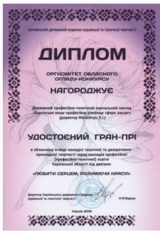
Рис. 3.11. Диплом Гран-прі Обласного огляду-конкурсу «Любити серцем, розуміючи красу»