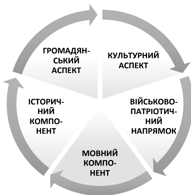
Рис. 1.2. Компоненти змісту національно-патріотичного виховання (побудовано автором за [9])

національним мистецтвом та народною творчістю. Мовний компонент є особливо важливим, адже передбачає досконале володіння державною мовою, шанобливе ставлення до неї як до скарбниці народної мудрості та культури. Громадянський аспект включає формування правової культури, політичної грамотності, моральних цінностей та активної життєвої позиції. Військово-патріотичний напрямок спрямований на підготовку молоді до захисту Вітчизни, виховання поваги до Збройних Сил України (ЗСУ), розвиток мужності, стійкості та готовності до самопожертви заради захисту державних інтересів [3].