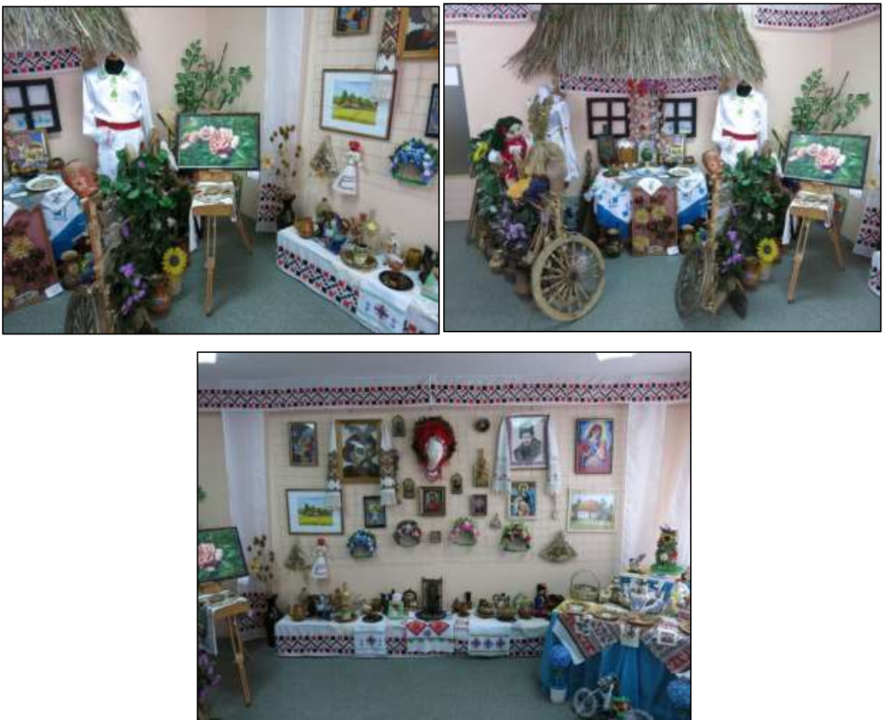
Рис. 3.1. Виставка «Ужитково-декоративне мистецтво Слобожанщини»

Перша виставка має назву «Ужитково-декоративне мистецтво Слобожанщини» (рис. 3.1).