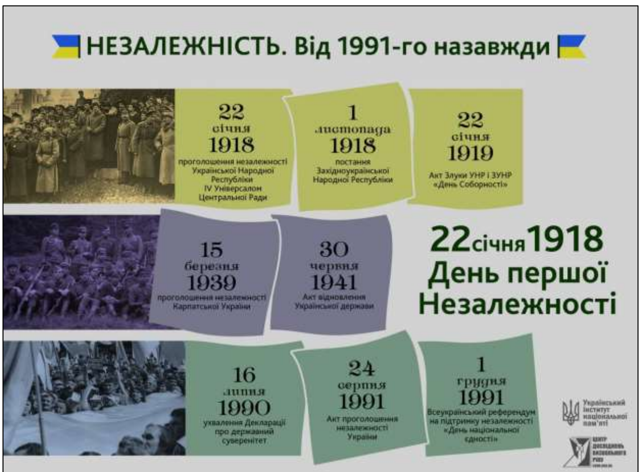
Рис. 1.6. Як творилася держава. Незалежність. Від 1991-го назавжди [29]