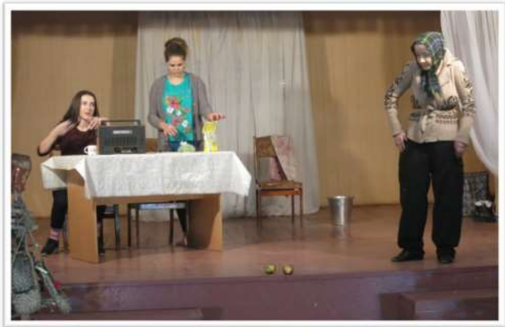
Рис. 3.7. Вистава «Незносні люди»