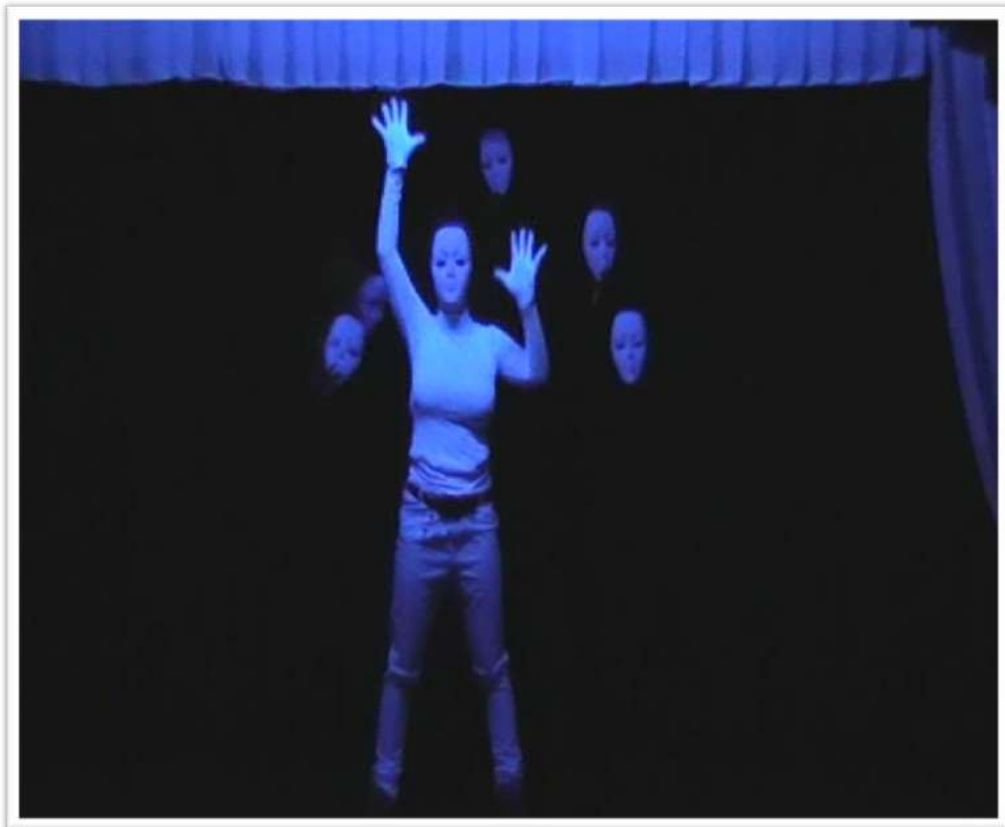
Рис. 3.8. Пластично-хореографічна постановка в ультрафіолеті «Думи» (авторська фотографія)