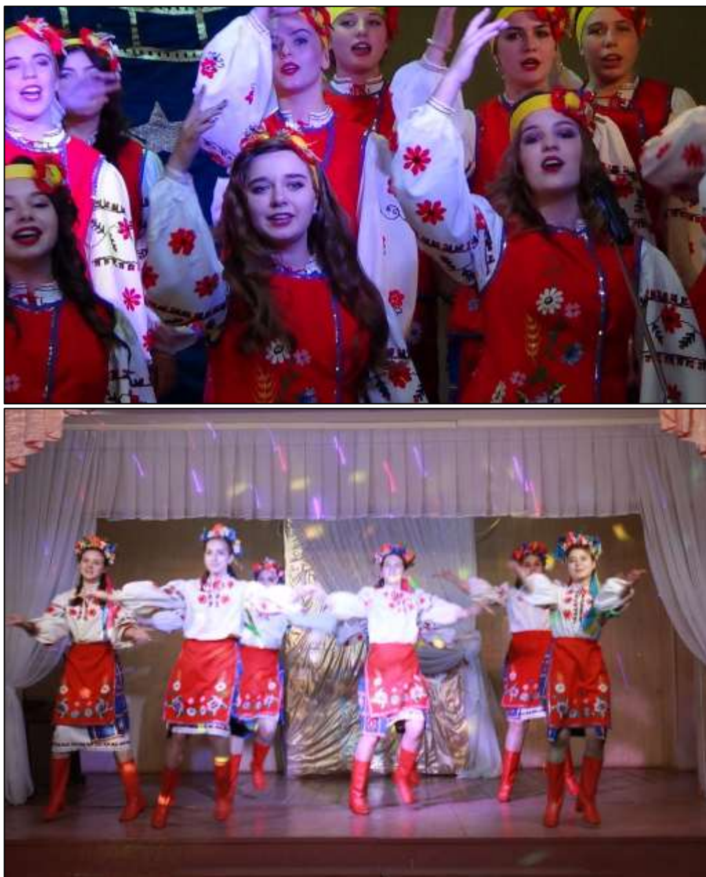
Рис. 3.5. Фрагменти концерту-конкурсу «Обласний огляд художньої самодіяльності (авторські фотографії)

Через різноманітні форми гурткової діяльності – святкові концерти, театральні постановки, літературно-музичні композиції, уроки-реквієми, КВК, флешмоби, тематичні вечори тощо – учні долучаються до вшанування пам'ятних дат, державних свят та визначних подій в історії України. Це сприяє вихованню поваги до національних традицій, збереженню історичної пам'яті, формуванню почуття гордості за свій народ та усвідомлення власної ролі в розбудові незалежної України.