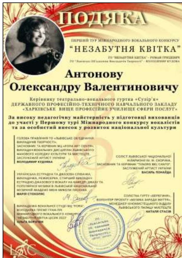
Рис. 3.17. Подяка міжнародного фестивалю-конкурсу «Незабутня квітка»