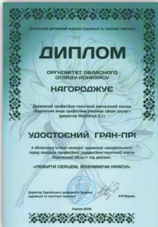
Рис. 3.10. Диплом Гран-прі Обласного огляду-конкурсу «Любити серцем, розуміючи красу»