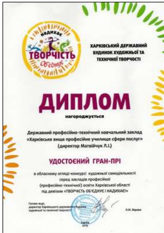
Рис. 3.12. Диплом Гран-прі Обласного огляду-конкурсу «Творчість об'єднує і надихає»