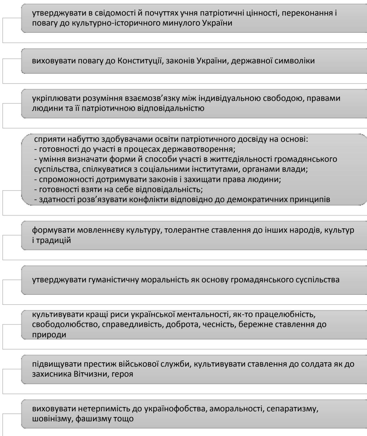
Рис. 1.1. Цілі національно-патріотичного виховання (побудовано автором за [29])

Історичний компонент передбачає вивчення історії України, її державотворення, визвольних змагань українського народу, досягнень у галузі політики, освіти, науки, культури і спорту. Культурний аспект охоплює знайомство з традиціями, звичаями, обрядами нашого народу,