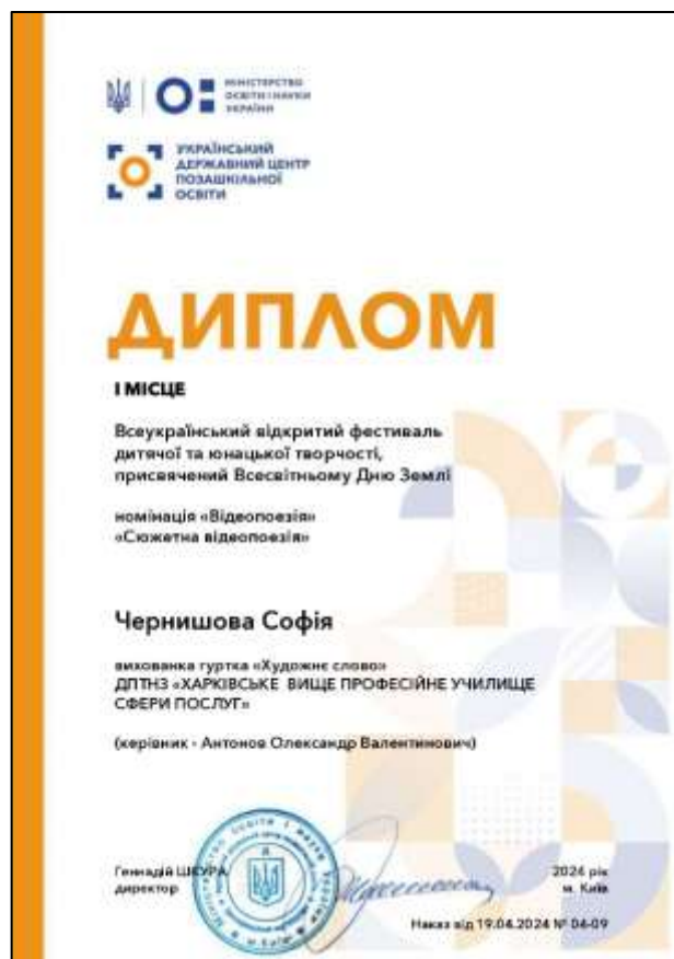
Рис. 3.19. Диплом за 1 місце у Всеукраїнському відкритому фестивалі, присвяченому Всесвітньому Дню Землі