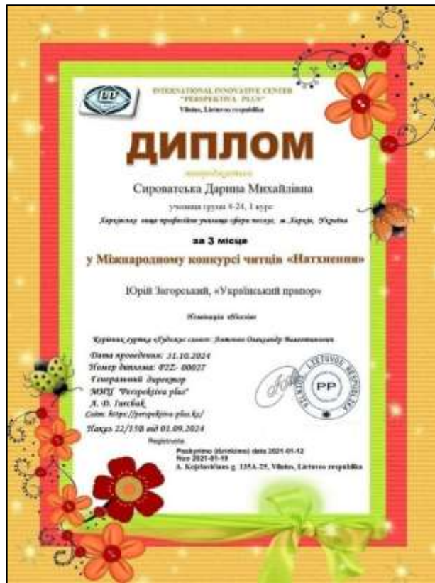
Рис. 3.18. Диплом за 3 місце в міжнародному конкурсі читців «Натхнення»