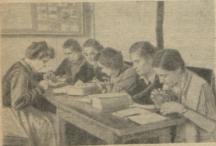
Студенти IV курсу біологічного факультету за самостійною роботою на кафедрі вищих рослин.