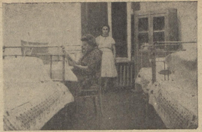
До нового учебного року студенты университета одержали цінний подарунок — вступив до ладу діючих новий гуртожиток на майдані Дзержинського. На фото: кімната № 121 в новому гуртожитку, де мешкають студенти V курсу фізико-математичного факультету.

Доцент М. БАЖЕНОВ, зав. кафедрою російської мови.