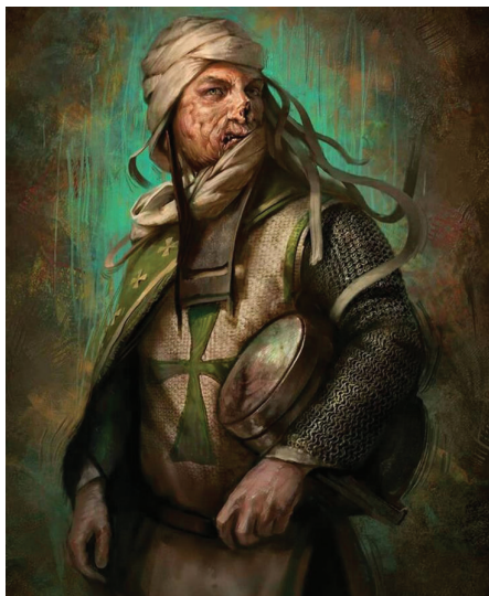
Рыцарь ордена св. Лазаря, пораженный проказой