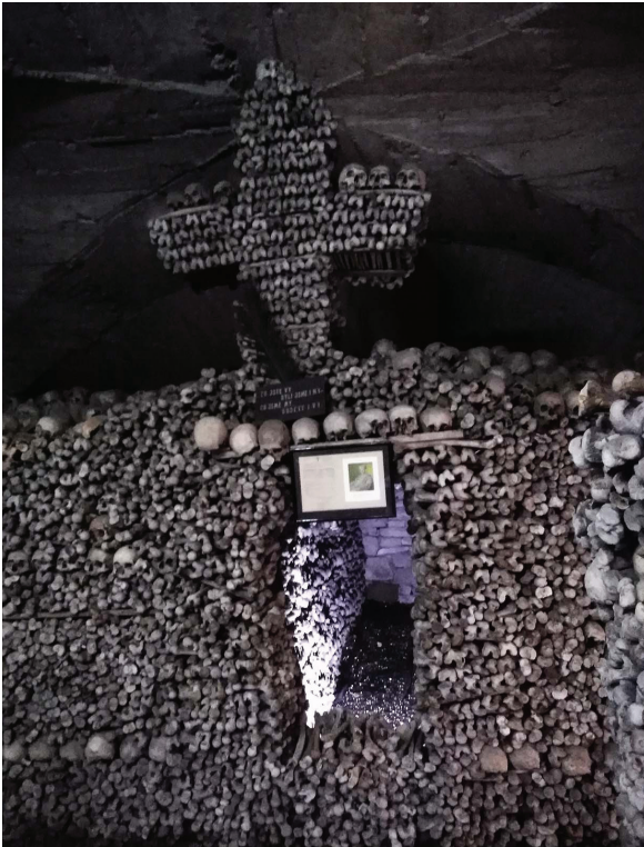
Костница замковой церкви. Замок Мелник. Чехия.