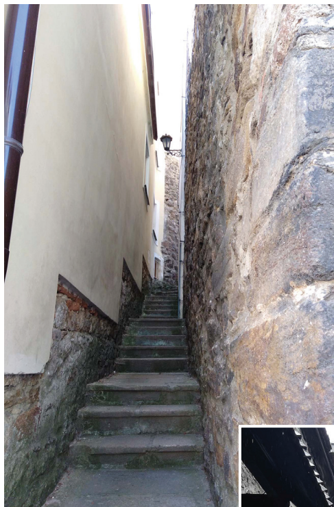
Средневековая улица. Град Локет. Чехия.