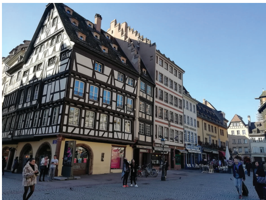
Здание средневековой аптеки. Страсбург, Франция.