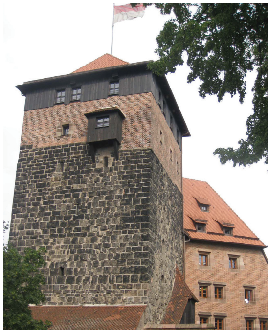
Сухой туалет в Императорском замке Нюрнберга. Германия.