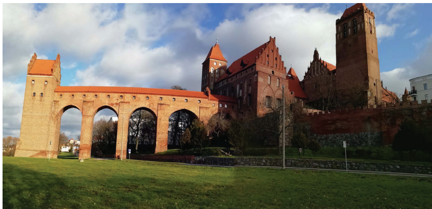
Длинная крытая галерея, соединяющая замок Квидзень с башней Гданиска (туалетная башня). Квидзень, Польша.