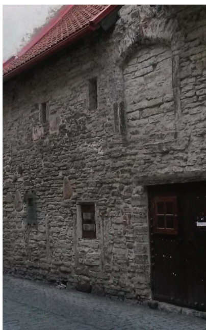
Средневековый дом. Таллин, Эстония.