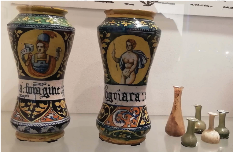
Банки средневековых аптекарей. Музей Николая Коперника. Фромборк, Польша.