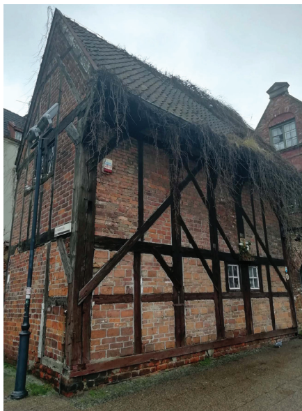
Классический средневековый дом с маленькими окнами. Гданськ, Польша.