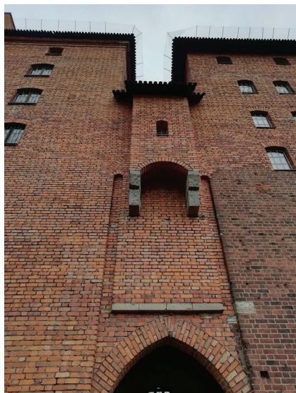
Сухой туалет замка Мальборк, Польша.