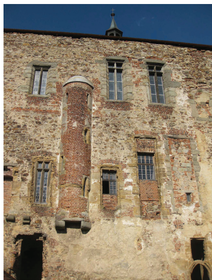
Башенка сухого туалета. Замок Точник, Чехия.