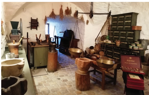
Средневековая аптека. Музей фармации. Гейдельберг, Германия.