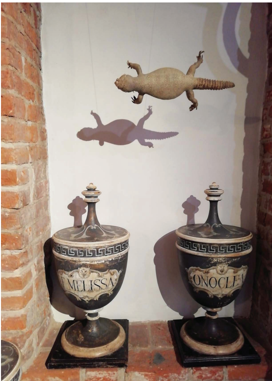
Средневековые аптечные сосуды для хранения трав. Музей Истории Медицины. Фромборк, Польша.