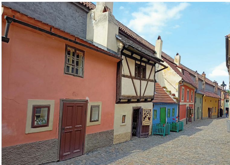
Злата улочка в Пражском граде. Прага, Чехия.