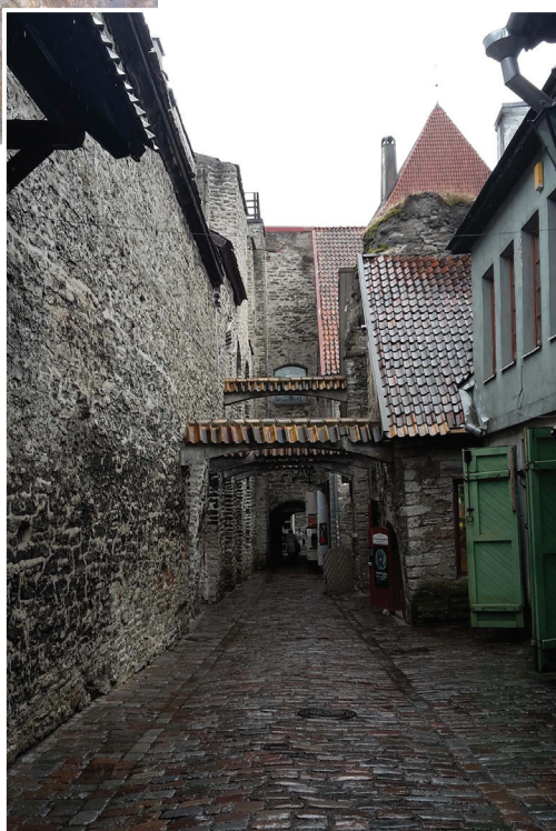
Типичная узкая и темная средневековая улица. Улица Катарина Кяйк. Таллин.