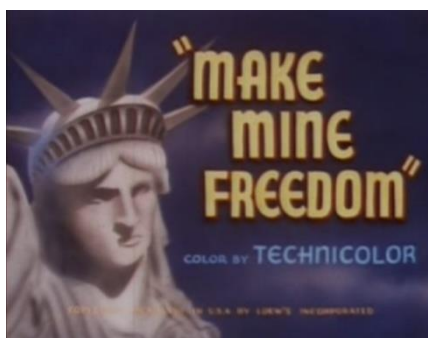
Фото 5. Заставка до мультфільму Make Mine Freedom