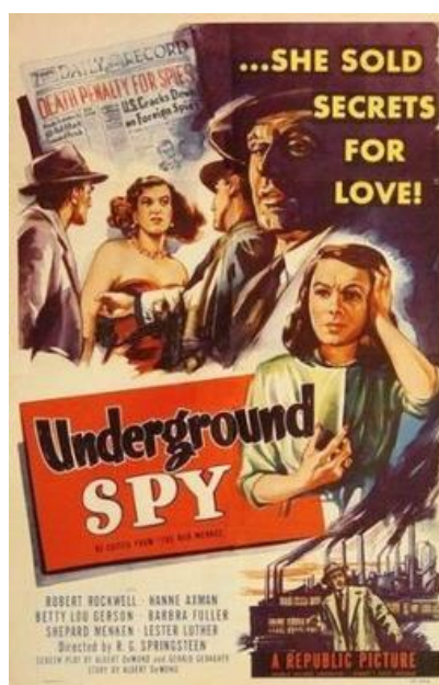
Фото 4. Постер до фільму The Red Menace