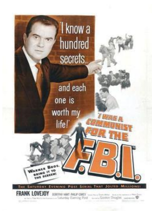
Фото 3. Постер до фільму I Was a Communist for the FBI