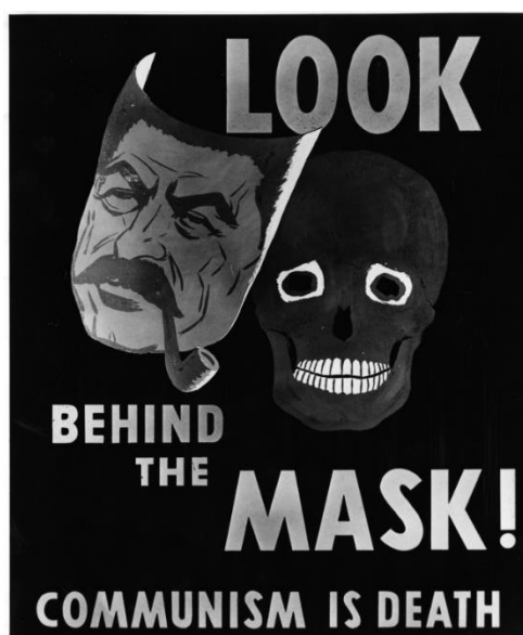
Фото 9. Плакат LOOK BEHIND THE MASK! COMMUNISM IS DEATH