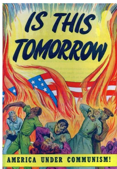
Фото 8. Обкладинка коміксу Is This Tomorrow: America Under Communism!