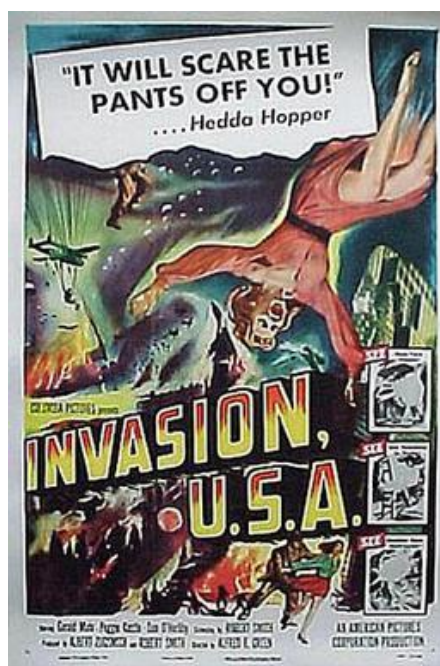
Фото 2. Постер до фільму Invasion, U.S.A.