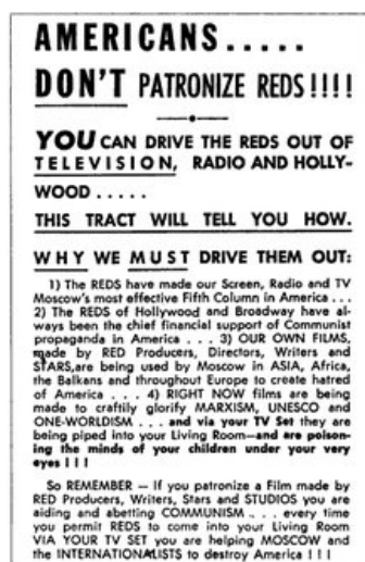
Фото 6. Листівка AMERICANS.... DON'T PATRONIZE REDS!!!!