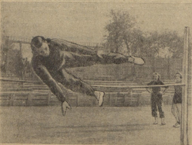
Посилено готуються студенти-легкоатлети до університетської спартакіади. Наш фотокореспондент сфотографував одне з останніх занять легкоатлетичної секції.