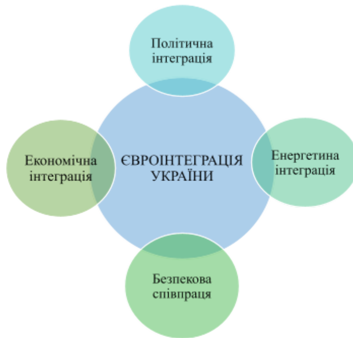
Рис. 2.2. Пріоритети євроінтеграційного розвитку України

Прогнози розвитку євроінтеграційного процесу України вказують на значний потенціал для поглиблення співпраці з Європейським Союзом в ключових сферах, таких як енергетика, економіка, політика та безпека. Україна має можливість реалізувати свої стратегічні цілі, однак це вимагає значних зусиль, щоб подолати існуючі виклики. Для успіху інтеграційного процесу важливо забезпечувати не лише політичну та економічну стабільність всередині країни, а й послідовність у проведенні реформ, спрямованих на адаптацію до європейських стандартів.