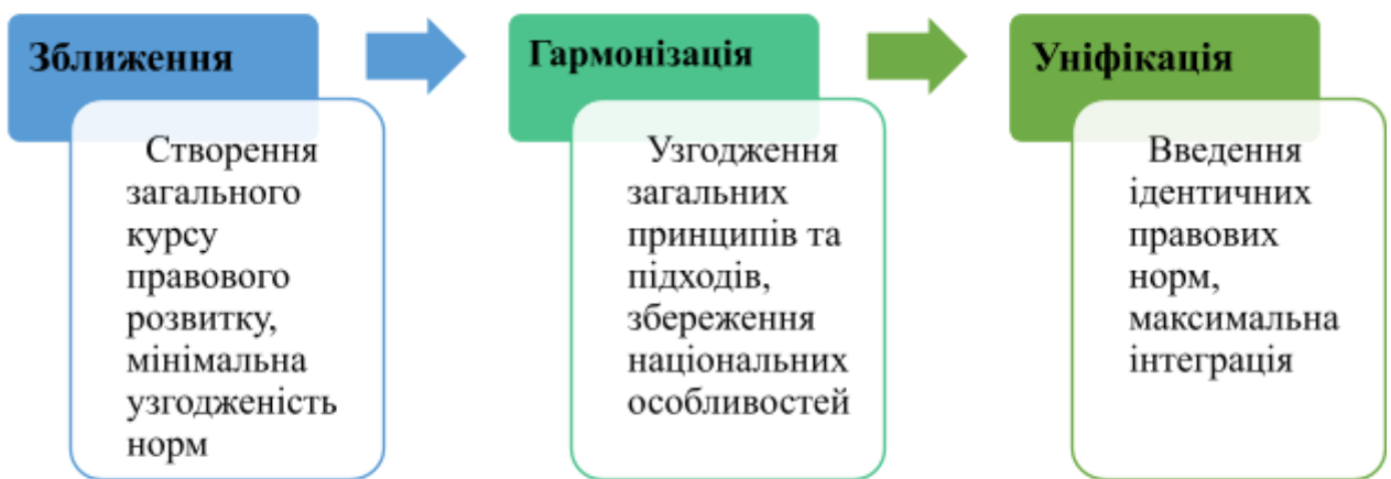
Рис. 1.2. Правова інтеграція [22]