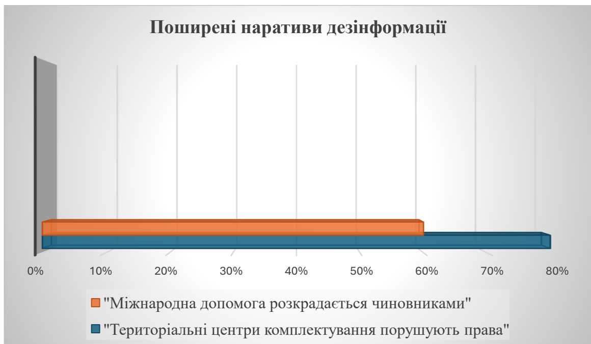
Рисунок 2.3 – Популярні нарративи дезінформації серед респондентів

Найбільш поширеними серед респондентів є наративи про порушення прав територіальними центрами комплектування (80%) та розкрадання міжнародної допомоги українськими чиновниками (60%). Ці дані детально проаналізовані на рис. 2.3. На мою думку, цей показник є свідченням того, що дезінформація здатна ефективно маніпулювати громадською думкою навіть за умов підвищеної обізнаності. Це вимагає застосування системного підходу до виявлення та нейтралізації основних джерел поширення маніпуляцій.