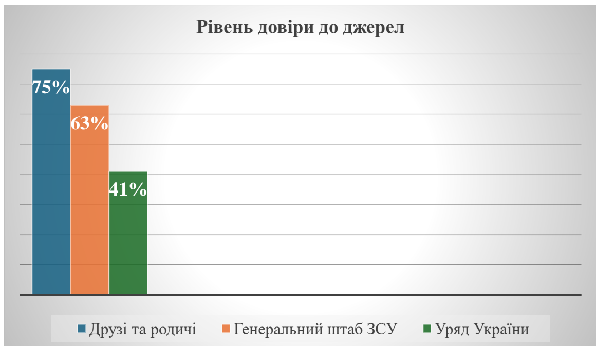
Рисунок 2.4 – Рівень довіри до різних джерел новин

Рівень довіри до друзів та родичів залишається найвищим (75%), тоді як довіра до офіційних джерел, таких як Генеральний штаб ЗСУ, впала до 63% (рис. 2.4).