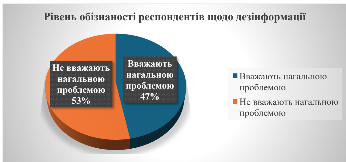
Рисунок 2.1 - Рівень обізнаності респондентів щодо дезінформації

• Згідно з даними дослідження USAID/Internews, 47% українців вважають дезінформацію нагальною проблемою [17]. Цей результат демонструє підвищення уваги громадян до інформаційних загроз у порівнянні з попередніми роками. Ці результати відображено на рис. 2.1. 72% респондентів заявили про здатність розпізнавати фейкову інформацію. Однак варто зазначити, що рівень впевненості у власній медіаграмотності може бути завищеним, що підтверджується поширенням деяких популярних дезінформаційних нарративів серед значної частини опитаних.