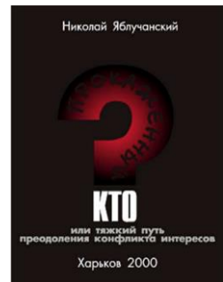
Прокажений хто, або важкий шлях подолання конфлікту інтересів?