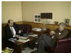
Професор О.С. Медведєв

діяльності. З першим деканом московського факультету фундаментальної медицини О.С. Медведєвим часто зустрічалися, обмінювалися ідеями, бував я у нього, і він у мене.