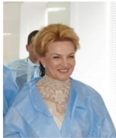
Міністр МОЗ Р.В. Богатирьова