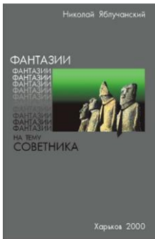
Фантазіях на тему радника

Тонкощі всього, що розмовів, можете знайти в моїй книжці - “Прокажений хто, або важкий шлях подолання конфлікту інтересів?”.