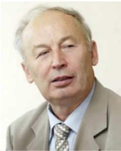
Міністр МОЗ А.М. Сердюк

Університет зруйнував монополію на медичну освіту, і МОЗ поставив за мету фактично відібрати в Університета право на неї. Нас діставали постійними комісіями, голови комісій знаходилися від телефонним контролем на той період Міністра МОЗ пана А.М. Сердюка, часто більше двох разів на рік, зі зрозумілою метою, але кожного разу комісії закінчувалися поразками. Найвидатніший випадок такої комісії, від рішення якої залежала можливість отримання першим випуском дипломів лікаря, в наступному сюжеті. Він на мій погляд виявився калькою знаменитих "Белых одежд"