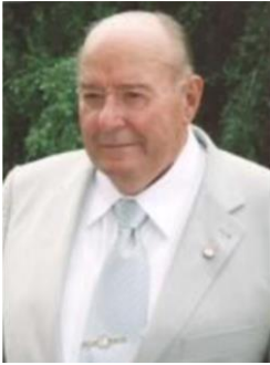
Ректор А.Я. Циганенко

Факультет відкрився в роки економічної депресії, яка охопила новостворену країну, грошей в Університеті не доставало на найпростіші речі. Навіть столи та стільці були проблемою.