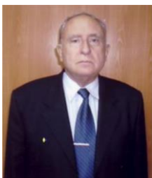
Академік А.Д. Візир