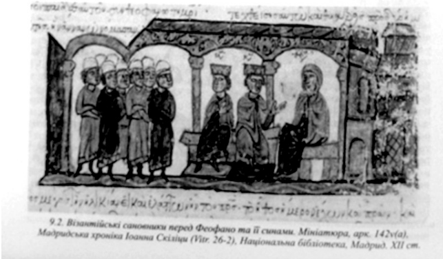
9.2. Візантійські сновихи перед Феодано та її сновим. Мініатюра, арк. 142v(a), Мадридська хроніка Іоанна Скліци (Vitr. 26-2), Національна бібліотека, Мадрид. XII ст.

Поряд із званнями, що надавалися «бородатим людям», у Візантії існували сани, якими нагороджували «безбородих» придворних, тобто снухів. Вони теж були пов'язані з початковим внеском і передбачали одержання платні. Одним з найвищих був сан проедра або глави сенату, наступним був вестарх – голова вестаріїв, власне вестарії , снухи-патрікції, прімікірії , остіарії – воротарі, спафарокуеїкулярії і куеїкулярії – снухи імператорської опочивальні, ніпсистерії – відповідальні за підготовку імператора до обмивання.