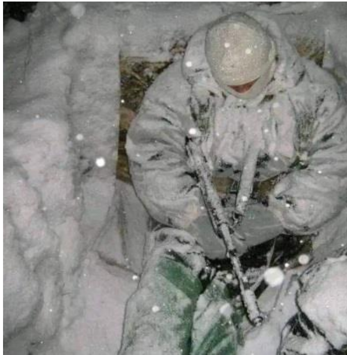
Рис. 2.15. – Фотофейк «Український солдат замерзає в окопі»

інформації та оперативне спростування фейків є ключовими елементами в боротьбі з пропагандою та захистом інформаційного простору.