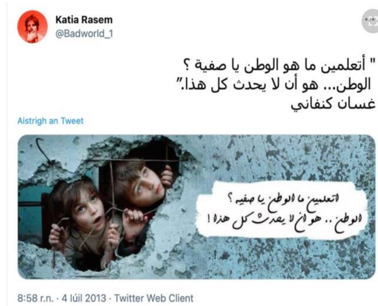
Рис. 2.14. – Справжня світлина дітей, опублікована сирійським поетом російські пропагандисти не лише маніпулюють свідомістю людей, поширюючи фальшиві фото дітей, але й намагаються дискредитувати український уряд та армію. Наприклад, у листопаді 2023 року ЗМІ країни-агресора опублікували зображення, на якому нібито показано українського солдата, що замерзає в окопі (рис. 2.15). Однак, з'ясувалося, що це фото не має відношення до російсько-української війни. Насправді, знімок зроблений щонайменше 10 років тому під час тренувань російського спецназу з виживання [33].

Такий приклад є частиною ширшої кампанії з дезінформації, спрямованої на підрив довіри до українських військових та створення негативного образу України на міжнародній арені. Використання таких старих зображень для маніпуляції громадською думкою підкреслює масштаб і цинізм інформаційної війни, яку веде росія.