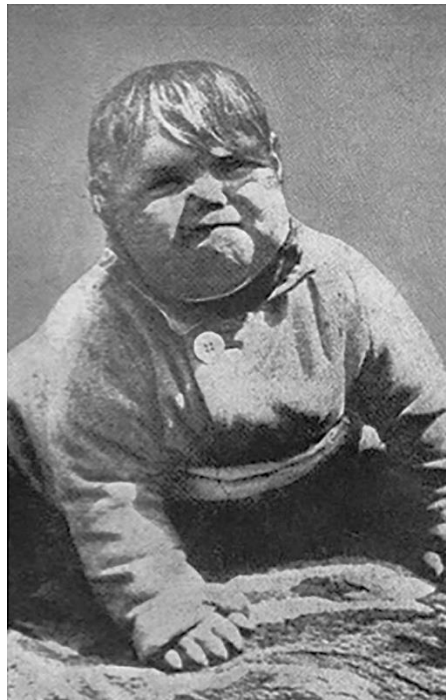
Рис. 2.12. – Фотофейк «Немовля Гітлер»

Один з класичних випадків фотофейку, який використовував зображення дитини, з'явився у британських та американських ЗМІ у 1933 році. Це фото начебто показувало майбутнього лідера нацистської Німеччини Адольфа Гітлера в дитинстві. На фотографії обличчя малюка виглядало тривожно та загрозово: зловісна усмішка, складені брови, напівзакриті очі та жирний пасмо волосся на чолі (рис. 2.12). Цей образ був явно спрямований на те, щоб вплинути на сприйняття Гітлера як фігури, яка вже в найранішому віці мала зловіщі риси, а тим самим підсилити негативне ставлення до нього. Використання фотографій у такому контексті підкреслює силу візуального впливу та важливість критичного ставлення до зображень, які можуть бути маніпульовані з метою формування громадської думки.