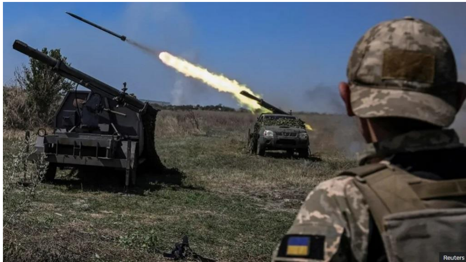
Рис. 2.8. – ЗСУ наносять удар по позиціям супротивника на півдні України

У публікації «Війна в Україні: «Люди називають нас привидами Бахмута» знову допущено серйозну помилку, аналогічну до тієї, що сталася в українському бюро новин: опубліковано фото військових, при цьому одного з них чітко видно (Рис. 2.9.). Подібне є неприпустимим з точки зору етичних стандартів і безпеки, оскільки публікація таких зображень може розкрити особу військового, що ставить під загрозу його життя та безпеку його родини [35].