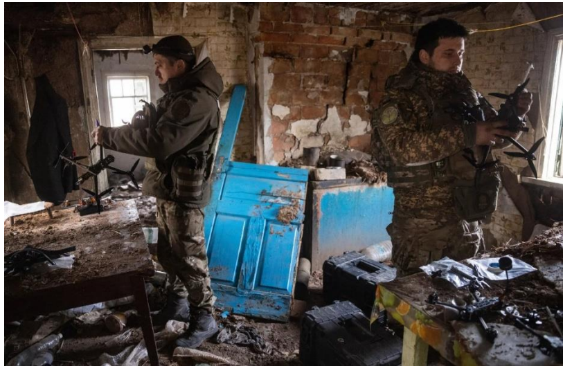
Рис. 2.11. – Фото українських військових, що знаходяться на позиціях поблизу Кремінної

бойових дій (Рис. 2.11.). Розкриття облич солдатів може призвести до їхньої ідентифікації ворогом, що підвищує ризик репресій і атак як на фронті, так і в тилу. Журналісти повинні усвідомлювати свою відповідальність за захист тих, кого вони зображують у своїх матеріалах, особливо в умовах війни. Дотримання етичних стандартів включає використання фотографій, на яких обличчя військових приховані, або їх ідентифікаційні ознаки замасковані, допомагаючи забезпечити безпеку особового складу і водночас інформувати громадськість про важливі аспекти війни. Висвітлення подій повинно бути збалансованим, враховувати як право суспільства на інформацію, так і безпеку тих, хто знаходиться на передовій [37].