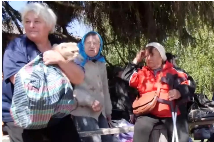
Рис. 2.4. – Евакуація українців із прикордоння Харківщини

спільноту, привертаючи увагу до гуманітарної катастрофи, спричиненої війною. Вони можуть сприяти мобілізації міжнародної підтримки та допомоги, підвищуючи обізнаність про реальну ситуацію на місцях. Водночас, журналісти повинні дотримуватися етичних стандартів, забезпечуючи добровільну згоду людей на публікацію їхніх зображень і захищаючи їхню гідність та безпеку. Публікація таких кадрів також служить важливим документальним свідченням злочинів, вчинених агресором. Вони можуть бути використані як докази в міжнародних судах і трибуналах, сприяючи притягненню винних до відповідальності. Таким чином, етичне і відповідальне висвітлення таких подій має критичне значення для правдивого інформування громадськості та підтримки справедливості [18].