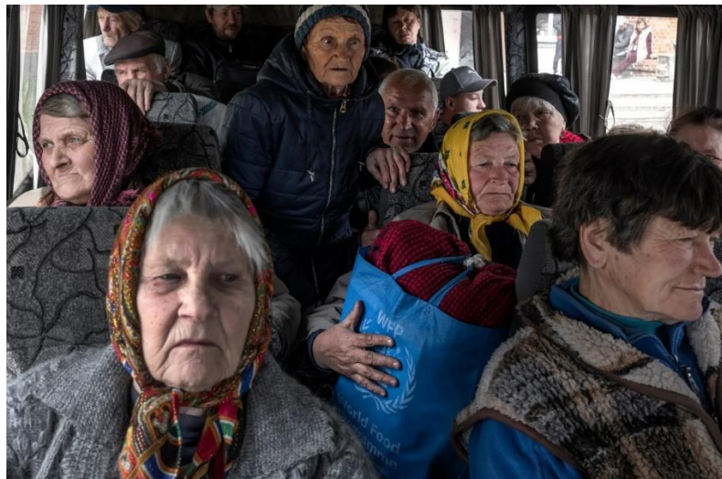
Рис. 2.10. – Фото евакуації жителів Вовчанська

евакуації цивільного населення з міста Вовчанськ (Рис. 2.10.). На зображеннях видно втомлених, розгублених людей, змушених покидати свої домівки через наступ російських військ. Такі фотографії, на нашу думку, повинні облетіти весь світ, щоб міжнародна спільнота усвідомила, що армія росії веде війну шляхом терору. Зображення не лише відображають людські страждання, але й демонструють жорстоку реальність війни, яку росія розв'язала проти України. Вони можуть стати потужним інструментом у приверненні уваги до гуманітарної кризи, спонукати до дій уряди інших країн та міжнародні організації, а також мобілізувати підтримку для України. Фотографії, що зображують страждання мирного населення, можуть допомогти світові зрозуміти масштаб трагедії та необхідність припинення агресії. Вони можуть викликати емпатію та солідарність, а також підштовхнути до більш рішучих дій щодо допомоги Україні та притягнення до відповідальності тих, хто вчиняє воєнні злочини. Таким чином, важливо продовжувати документувати та поширювати такі свідчення, щоб показати правду про війну в Україні та стимулювати міжнародну спільноту до активніших дій у підтримці українського народу [41].