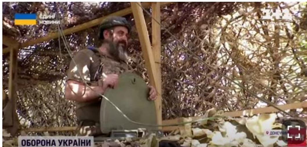
Рис. 2.3. – Фотографія військового зі 110-ї бригади, яка воює на Бахмутському напрямі

зображеного військовослужбовця, але й його товаришів по службі та цивільних осіб, які можуть опинитися в зоні обстрілу. Крім того, публікація таких фотографій може завдати емоційної шкоди родичам військових, які вже перебувають у стані постійного стресу. Журналісти повинні усвідомлювати відповідальність, яку вони несуть, публікуючи фотографії з передової. Використання фотографій має бути обґрунтованим і здійснюватися з дотриманням всіх етичних норм, щоб не наразити на небезпеку людей і не сприяти розповсюдженню стратегічно важливої інформації. У таких випадках, варто використовувати загальні фото або зображення, які не розкривають конкретних деталей і не можуть бути використані ворогом для нанесення шкоди [17].