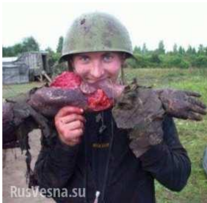
Рис. 2.16. – Фотофейк «Українець їсть руку кацапа»

Ще одним широко розповсюдженим фотофейком є зображення, на якому нібито український військовий їсть руку вбитого російського солдата (рис. 2.16). Насправді ж це фото було зроблено під час зйомок фільму «Ми з майбутнього» у 2008 році. Чоловік на світлині є художником-реквізитором