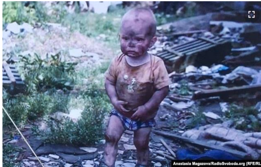
Рис. 2.13. – Фотофейк «Маленький хлопчик на Донбасі шукає свою маму»

На іншій фотографії показані діти, що визирають з-під руїн будинку, які нібито знаходяться на Донбасі. Проте, як з'ясувалося, це зображення було вперше опубліковане в соціальних мережах сирійським поетом ще 4 липня 2013 року (рис. 2.14), тобто задовго до початку окупації Донецької та Луганської областей.