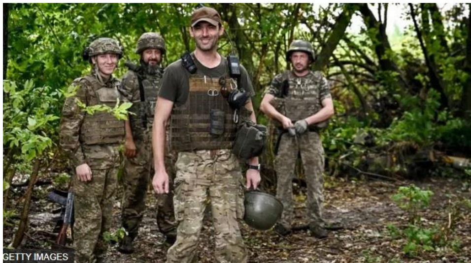
Рис. 2.5. – Факт публікації фото українських військових кореспондентами «BBC News Україна»

призвести до ворожих обстрілів та підвищення ризику для життя солдатів. Крім того, подібні публікації можуть деморалізувати особовий склад та їхні сім'ї, які побоюються за безпеку своїх рідних. Журналісти повинні усвідомлювати відповідальність за кожен опубліковану фотографію, особливо в умовах війни. Етичне висвітлення військових подій передбачає не тільки об'єктивність та достовірність, але й уважність до деталей, які можуть поставити під загрозу життя людей. Використання загальних, менш ідентифікаційних зображень або фотографій з попередніх подій, які не розкривають актуальних позицій чи тактичних деталей, може бути більш доцільним підходом. Таким чином, виданням слід ретельно аналізувати контент перед публікацією, щоб не нашкодити тим, кого вони намагаються підтримати своєю журналістською діяльністю [13].