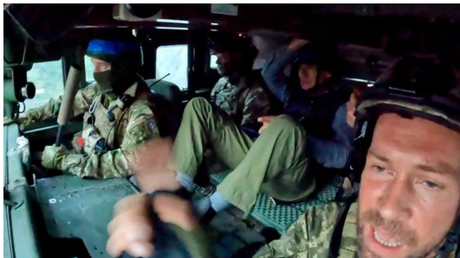
Рис. 2.9. – Фото зі статті «ВВС», на якій видно бійців ЗСУ

У публікації «Війна в Україні: «Люди називають нас привидами Бахмута» знову допущено серйозну помилку, аналогічну до тієї, що сталася в українському бюро новин: опубліковано фото військових, при цьому одного з них чітко видно (Рис. 2.9.). Подібне є неприпустимим з точки зору етичних стандартів і безпеки, оскільки публікація таких зображень може розкрити особу військового, що ставить під загрозу його життя та безпеку його родини [35].