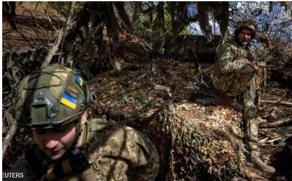
Рис. 2.6. – Фото українських військових поблизу Часового Яру

У публікації «Удар по Дніпру – є загиблі та багато поранених. Україна вперше знищила російський Ту-22М3 і ракети Х-22» крім фото зруйнованого будинку на Вокзальній площі у Дніпрі, також показано зображення дитячого майданчика, який, імовірно, знаходиться з іншого боку будівлі. Перевірити, чи це фото дійсно стосується цієї місцевості та атаки росії на місто 19 квітня, можуть лише місцеві жителі, впізнавши своє подвір'я. Адже під час пошуку на «Google» за запитом «ракетний удар по Дніпру 19 квітня» такої світлини немає (Рис. 2.7). Проте, навіть якщо це фото ілюстративне, воно має право на існування у цьому контексті, оскільки під час атаки постраждали не лише дорослі, але й діти. Світова громадськість повинна бачити наслідки агресії та розуміти її вплив на життя мирних мешканців, включаючи дітей. Важливо підкреслити, що використання таких зображень повинно супроводжуватися відповідними підписами, що пояснюють контекст і можливі джерела фотографій, аби уникнути дезінформації та маніпуляцій. Такі зображення є важливими для демонстрації масштабів руйнувань та гуманітарних наслідків війни. Вони допомагають привернути увагу міжнародної спільноти до трагедії, що розгортається в Україні, і можуть сприяти збільшенню підтримки та допомоги з боку інших країн. Однак, журналістам слід бути обачними у використанні ілюстративних фото, забезпечуючи їх відповідними поясненнями і зберігаючи довіру аудиторії [28].