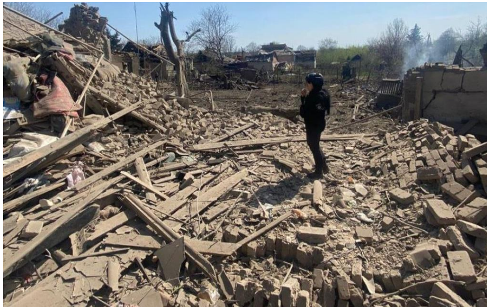
Рис. 2.2. – Фото руїн на Донеччині

невизначеність у виборі зображень може ввести в оману читачів і знизити довіру до джерела інформації (Рис. 2.2.). Крім того, використання ілюстративних фото без чіткого пояснення їхнього контексту може створити плутанину та дезорієнтацію серед аудиторії. Подібне особливо важливо в умовах війни, коли точність і достовірність інформації мають вирішальне значення для підтримки морального духу населення та забезпечення належної обізнаності про ситуацію. Журналістам варто ретельно підбирати фотографії, забезпечуючи їх відповідними підписами та контекстом, щоб уникнути двозначності та підвищити довіру читачів до своїх матеріалів. Використання актуальних та достовірних зображень допоможе забезпечити більш точне висвітлення подій та підтримати інформаційну гігієну в умовах війни [8].