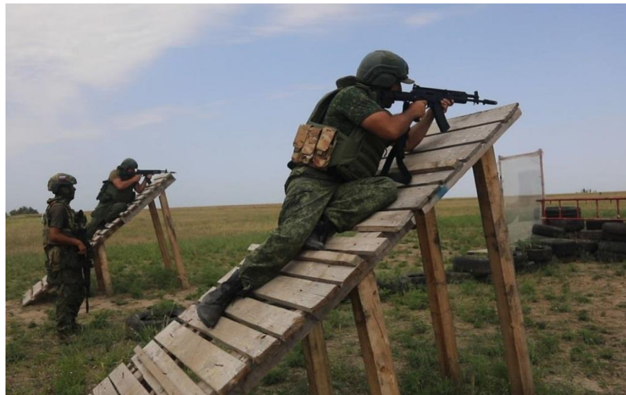
Рис. 2.1. – Фото тренування російських військових у публікації «ТСН»

новинами про можливі наступи російських військ на українські області. Замість цього, новину варто було б подати без фото або використати зображення захоплених у полон російських солдатів, які виглядають виснаженими і погано екіпованими. Таке б вселило віру в перемогу ЗСУ і зміцнило моральний дух українців у боротьбі проти ворога. Також важливо враховувати психологічний вплив візуальних матеріалів під час війни. Публікація фотографій, які підкреслюють слабкість або неорганізованість російських військ, може допомогти зменшити страх і тривогу серед населення, а також підтримати бойовий дух української армії та суспільства в цілому. Крім того, такі зображення можуть посилити віру в здатність ЗСУ успішно захищати країну і перемагати агресора. Зважаючи на це, журналістам слід ретельно підходити до вибору фото для новин про військові події, щоб забезпечити не лише інформативність, але й підтримку морального духу та національної єдності [19].