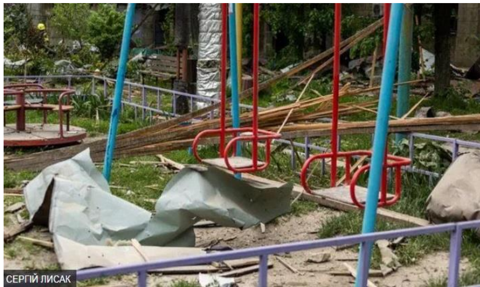
Рис. 2.7. – Фото дитячого майданчика із місця ракетного удару по Дніпру

Війна в Україні привернула значну увагу світових медіа ще з початку російсько-українського військового конфлікту у 2014 році. Починаючи з 24 лютого 2022 року, Україна стала центральною темою у більшості західних медіа, таких як «BBC», «CNN», «New York Times» та інших. Величезна кількість кореспондентів, незважаючи на небезпеку, прибула до України для висвітлення подій. Як зазначив радник голови Офісу Президента України Михайло Подоляк у своєму інтерв'ю від 10 березня 2022 року, майже 2000 іноземних журналістів щодня перебувають у найгарячіших точках війни. Широка присутність міжнародних журналістів важлива в контексті донесення правдивої інформації про події в Україні до світової спільноти. Їхні репортажі допомагають формувати глобальну думку про конфлікт, привертають увагу до гуманітарної кризи та мобілізують міжнародну підтримку. Крім того, присутність іноземних кореспондентів створює додатковий тиск на агресора, оскільки кожен воєнний злочин і акт насильства стають відомими усьому світу. Міжнародні журналісти також працюють у співпраці з українськими колегами, що дозволяє глибше зануритися в контекст подій і забезпечує більш комплексне висвітлення ситуації. Незважаючи на ризики, вони залишаються на передовій, щоб надати світу непередбачувані та реалістичні репортажі, що розкривають справжню природу конфлікту і його вплив на життя звичайних