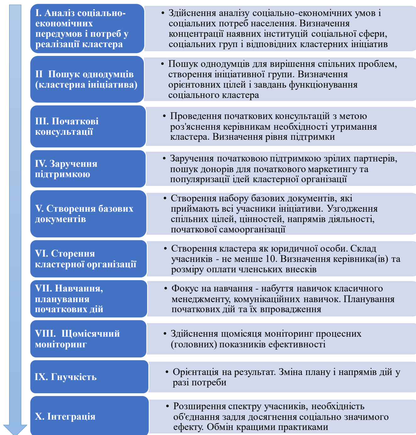
Рис. 1.2. Блок-схема загального алгоритму створення та розвитку соціального кластера

рішення щодо подальших дій. Також до ініціативної групи можуть увійти представники публічної влади (представники органів державної влади на місцях (з галузевих управлінь, департаментів, відділів), органів місцевого самоврядування (представники спеціалізованих структурних підрозділів територіальних громад), бізнес-структур, спеціалізованих недержавних, міжнародних організацій тощо.