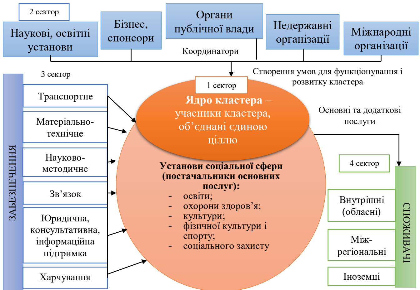
Рис. 1.3. Типова модель публічного управління розвитком регіонального соціального кластера

діяти як єдина мережева форма, що об'єднує постачальників і споживачів соціальних послуг. На нашу думку, такий кластер можна назвати регіональним, він є багатопрофільним, оскільки надає послуги різного напрямку й характеру. Типову модель публічного управління розвитком такого кластера представлено на рис. 1.3.