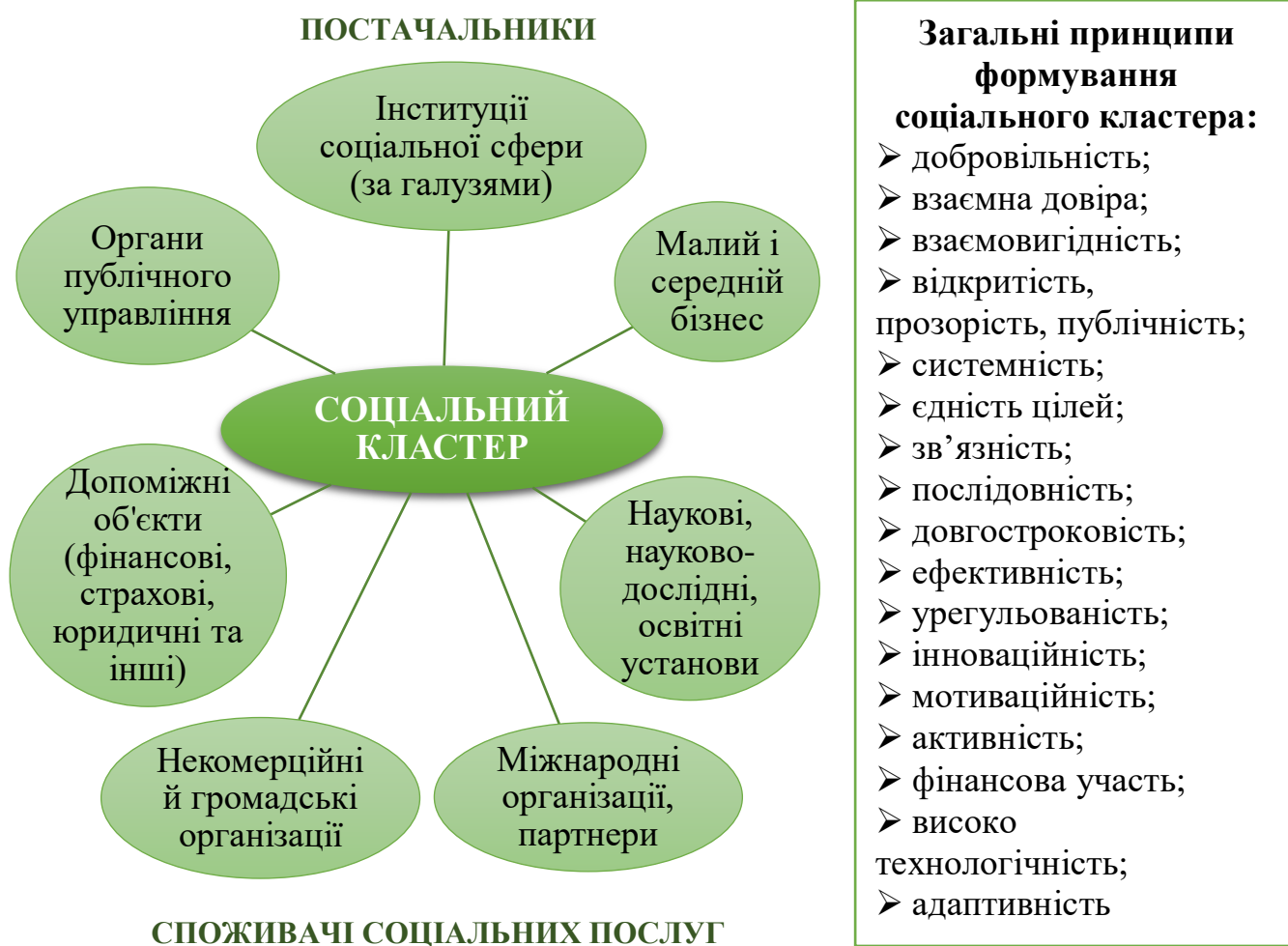
Рис. 1.1. Групи учасників соціального кластера та загальні принципи формування

В цілому, структуру кластера складають чотири сегмента – ядро, постачальники соціальних послуг, споживачі цих послуг та підтримуюча інфраструктура. Кожна з наведених на рисунку груп здійснює соціальний захист населення, забезпечує технічну, технологічну, юридичну, інвестиційну, інноваційну, консультативну, складську, транспортну, логістичну та інший вид підтримки. Учасники об'єднані спільними інтересами та цілями щодо соціально-економічного розвитку території, модернізації соціально значимих інфраструктурних елементів, що впливають на підвищення якості життя місцевого населення. Звичайно, що