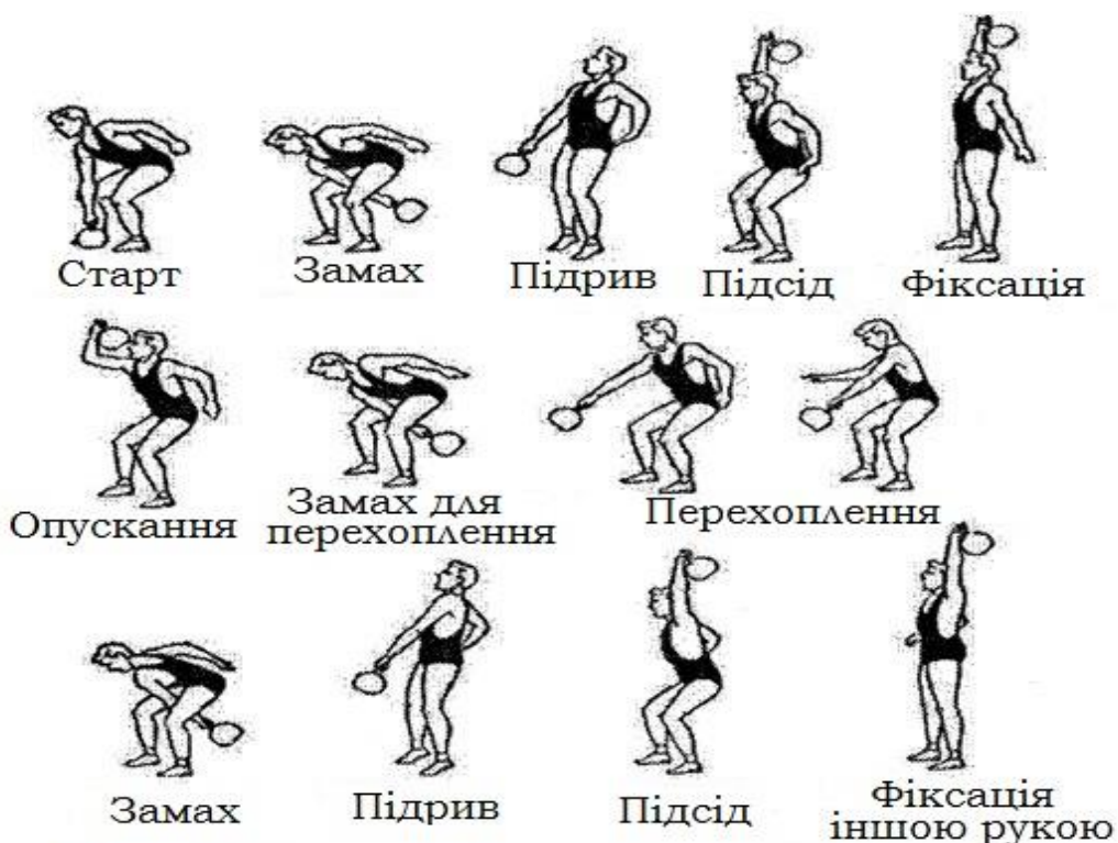
Малюнок 1 - техніка виконання ривка

Повний цикл цієї вправи можна умовно розділити на кілька технічних елементів: старт, замах, підрив, підсід, фіксацію, опускання гирі; потім замах для перехоплення, перехоплення, замах, підрив, підсід і фіксацію іншою рукою (мал. 1).