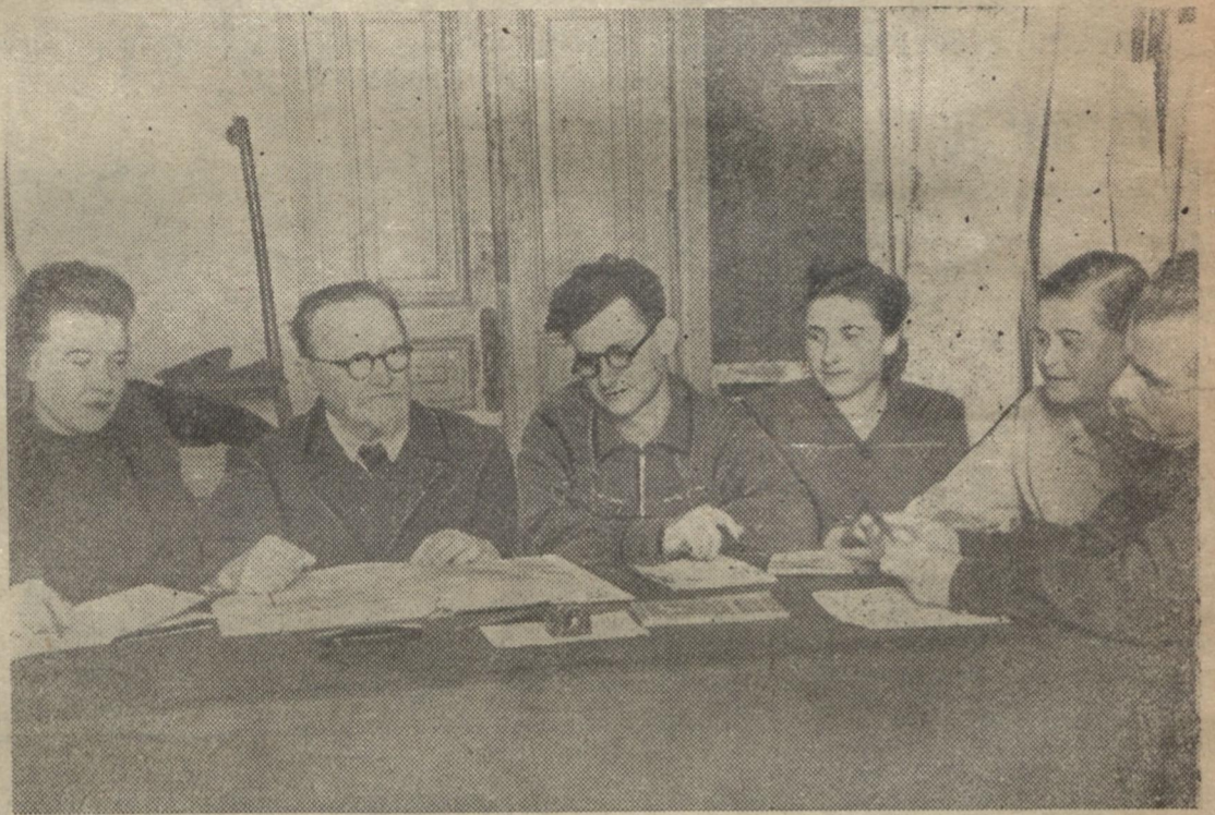
Новий могутній загін радянських спеціалістів випускають в цьому році факультети. Всюди, куди б не надіслала їх рідна Батьківщина, вони з честю несимуть звання випускника Харківського університету.

Кращі студенти факультету, яких комісія направляє до західних областей України, принесли велику користь Батьківщині в справі ідейного виховання підрастаючого покоління молодих будівників комунізму.