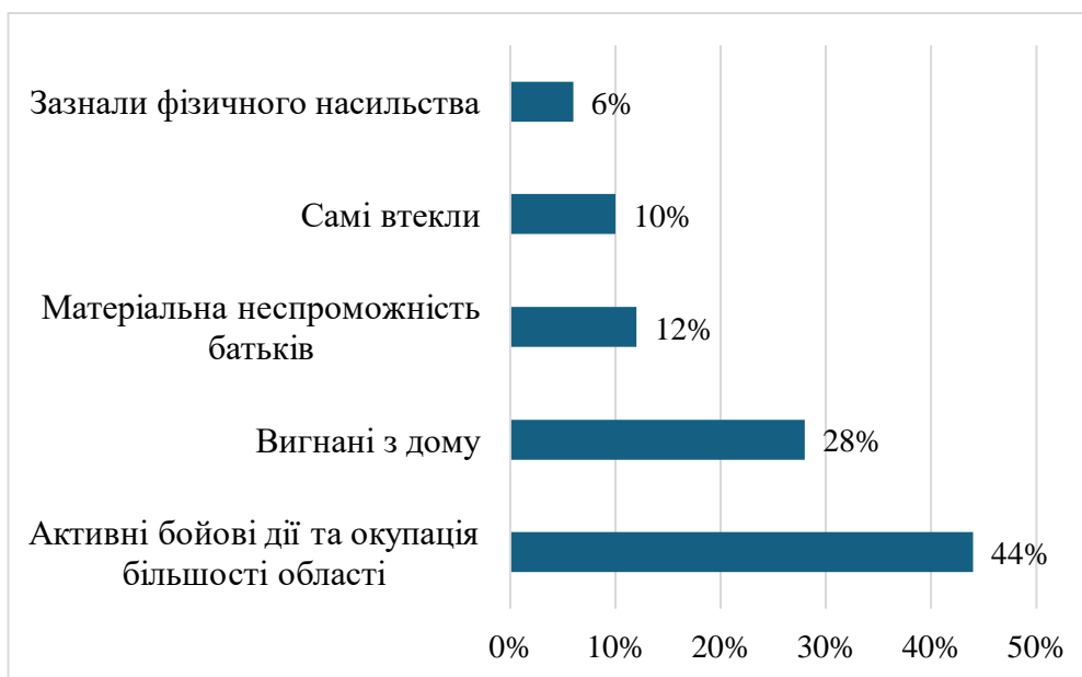
Рис. 2.2. Результати опитування серед безпритульних дітей Запорізької області

За результатами опитування дітей із Запорізької області [15], які опинилися на вулиці через війну, можна виділити такі основні причини: 44% постраждали внаслідок активних бойових дій та окупації значної частини Запорізької області, 28% були вигнані з дому, 10% самостійно покинули домівки, 12% опинилися на вулиці через матеріальну неспроможність батьків, а 6% зазнали фізичного насильства в сім'ї.