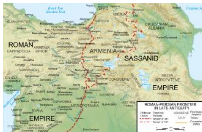
Битва при Каллінікі (531)