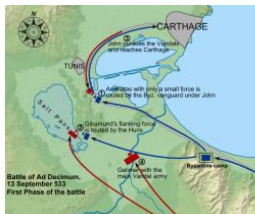
Битва під Ад Децимум 533 р.