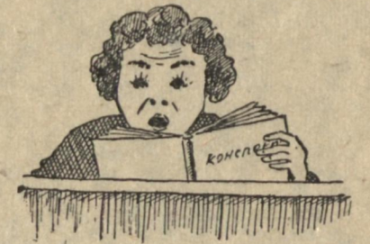
«Краще пізніше, ніж ніколи»