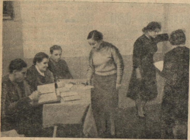
Сьогодні особливо напружений день в агітпункті по виборах у народні суди, що розташований у гуртожитку по пр. Леніна, 20. Все повинно бути готовим. Завтра — вибори.