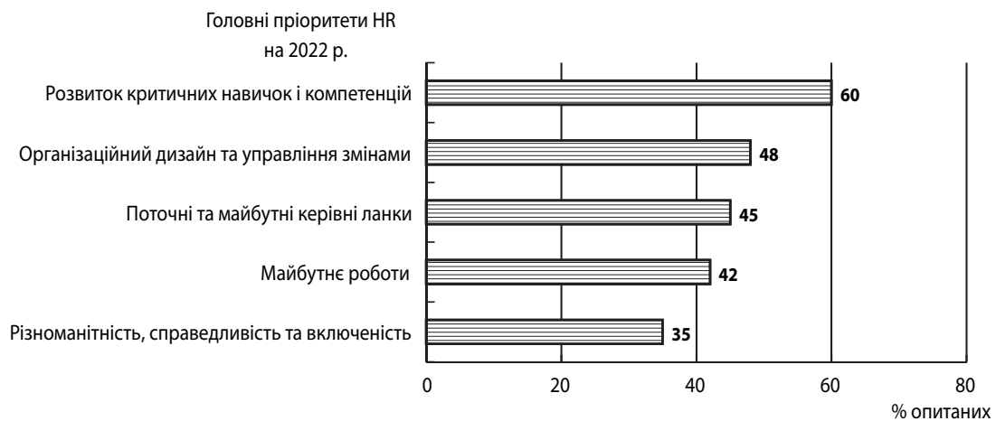
Рис. 3. Головні пріоритетні напрями HR-менеджменту на 2022 рік