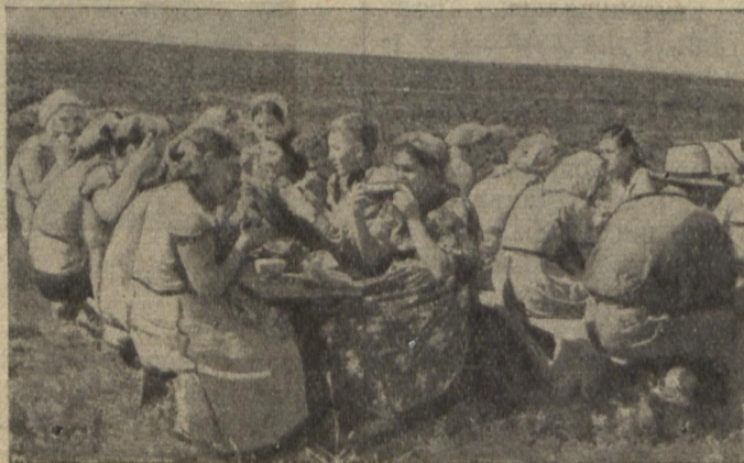
На фото: Після старанної праці обід здається особливо смачним.

Також добре відпочивають після роботи всі наші студенти. А коли де-небудь і