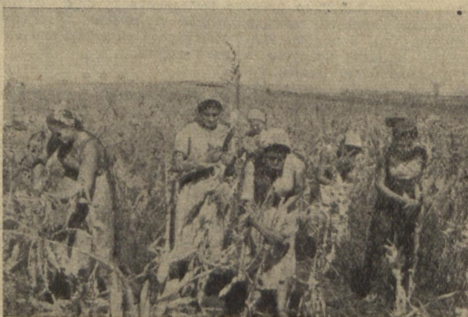
На фото: 4-й російський під час роботи.

Вечері збираємося всією групою, ділимося враженнями. Роксані Черкасовій дуже подобається, що у дворі