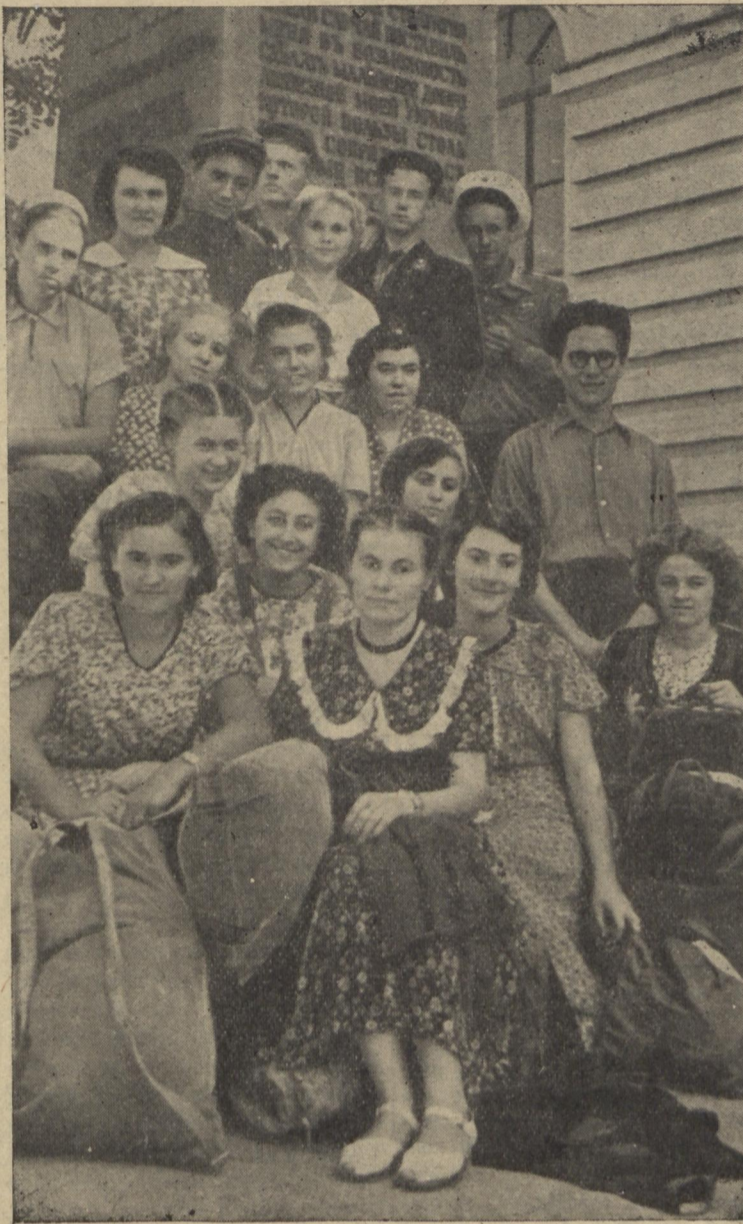
На фото: Студенти перед від'їздом на поля Запоріжжя.