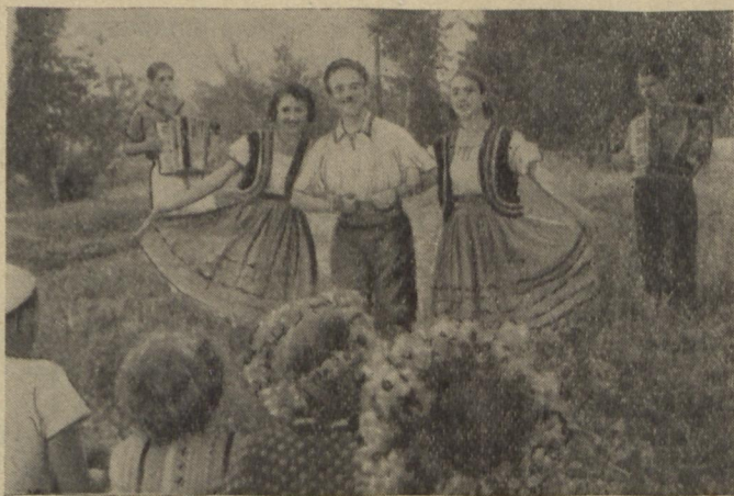
На фото: Під час чергового концерту.

В підготовці агіткультбригади були і недоліки з боку комітету комсомолу. Бригада готувалася у поспіху і укомплектовувалася у першу чергу тими, кого вдалося розшукати, в наслідок цього репертуар оказався трохи однобічним. Але поступово це налагодилося. Недоліків в репертуарі вдалося цілком запобігти дякуючи ініціативі учасників бригади. Ледве поїзд відійшов від вокзалу, керівник бригади Віктор Лебедев вла-