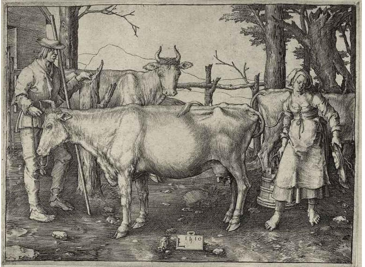
Рис. 2. Гравюра «Молочниця»

Гравюра 1510 р. нідерландського художника Лукаса Хейгенса ван Лейдена