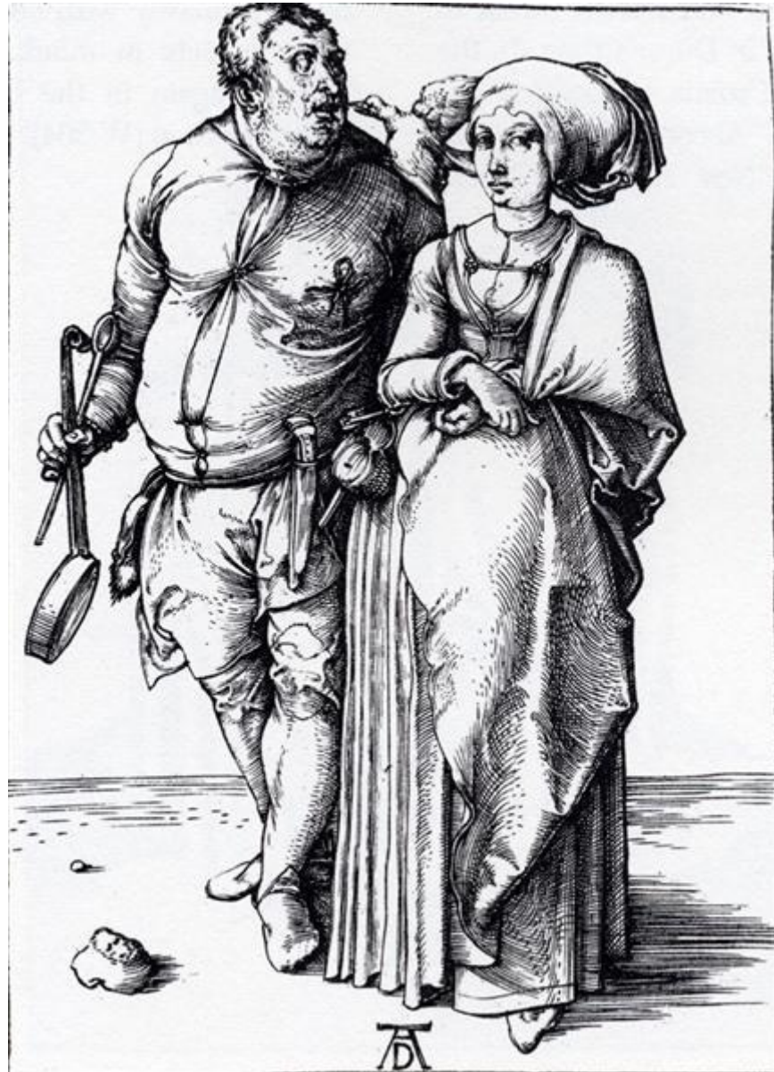
Рис. 1. Гравюра «Кухар з дружиною» А. Дюрера