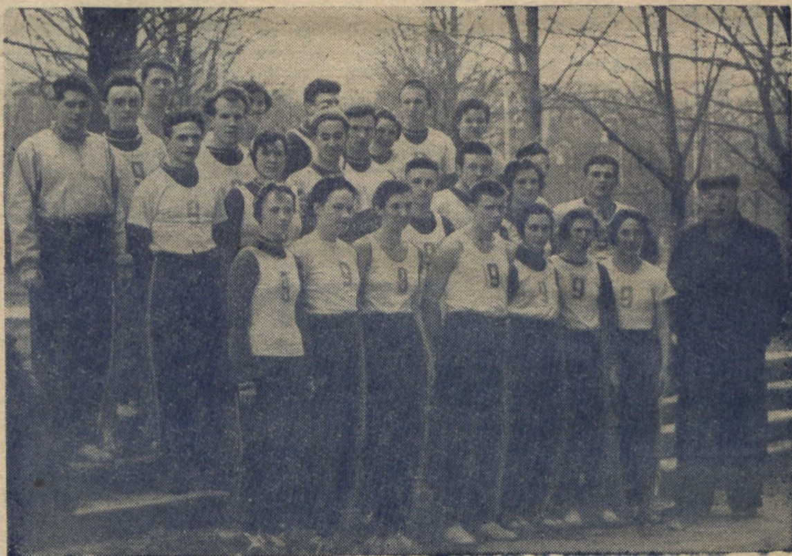
НА ФОТО: Команда легкоатлетів, що завоювала друге місце на міській міжвузівській естафеті.