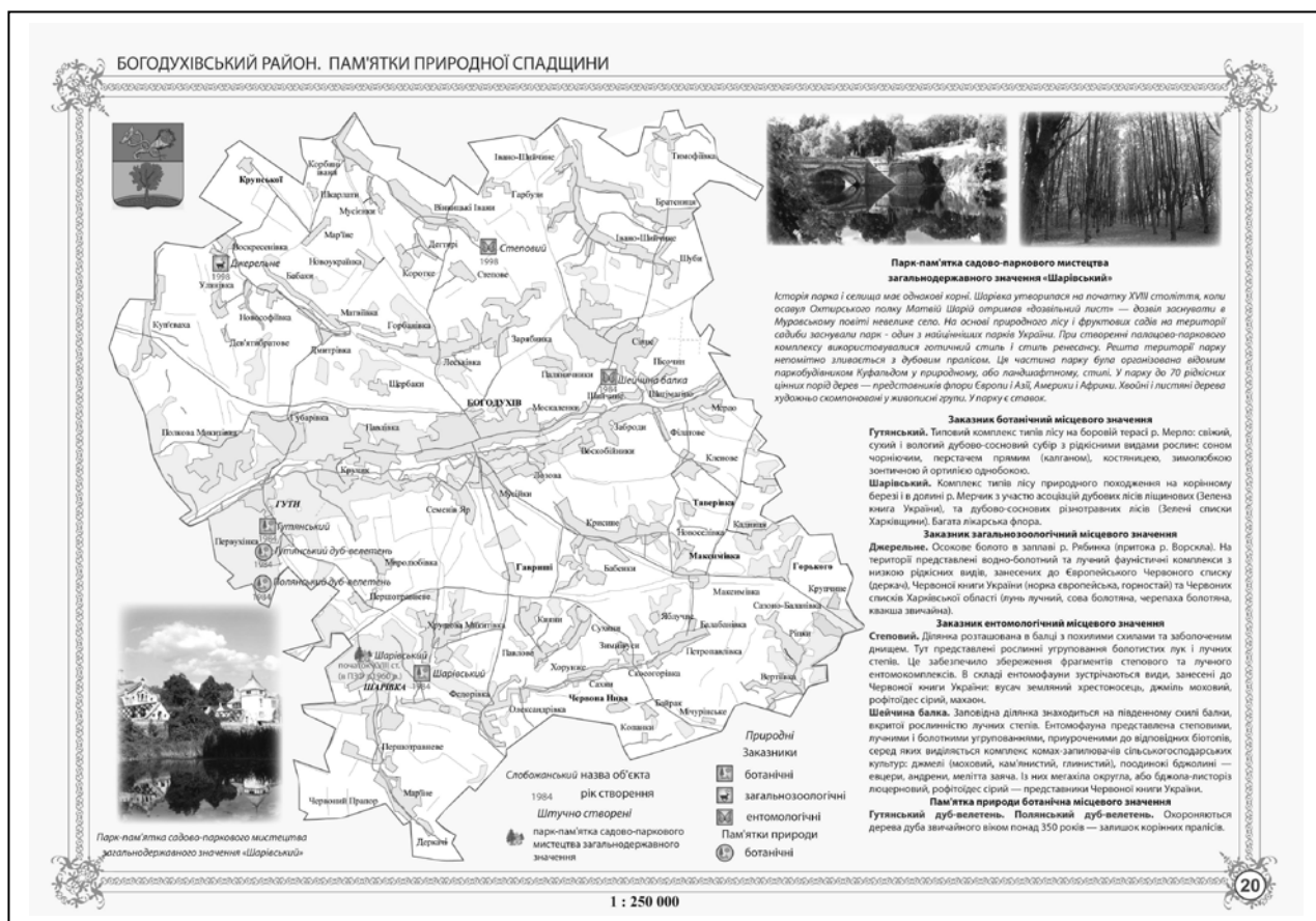
Рис.2. Карта другого розділу атласу «Природна та історико-культурна спадщина Харківської області».

Дотримання принципу внутрішньої єдності атласу вимагає використання мінімальної кількості проєкцій, кратних масштабів карт, їх мінімальної кількості. У зв'язку з цим, для карт атласу обрано масштаби: Україна – 1: 15 000 000; Харківська область – 1:1 500 000, адміністративні райони області – 1:250 000. Масштабний ряд узгоджується з вибором формату атласу (30 x 21 см, формат А4) і розробкою типових компоновок сторінок атласу (рис.1, 2).