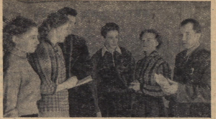
10 березня на зборах шефського активу університету. Розмова почалася ще до їх відкриття.