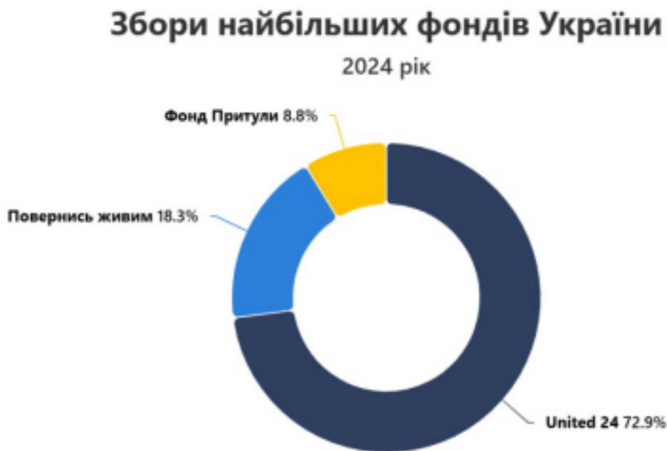
Рис. 3.1. Збори провідних благодійних фондів України

Попри зобов'язання, лише 23% благодійних організацій в Україні подали фінансову звітність за 2024 рік. Це свідчить про необхідність посилення контролю та стимулювання прозорості в секторі благодійності.