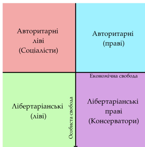
Рис. 1.1. Політичний спектр.

Сучасний політичний спектр зображено на Рис.1.1.