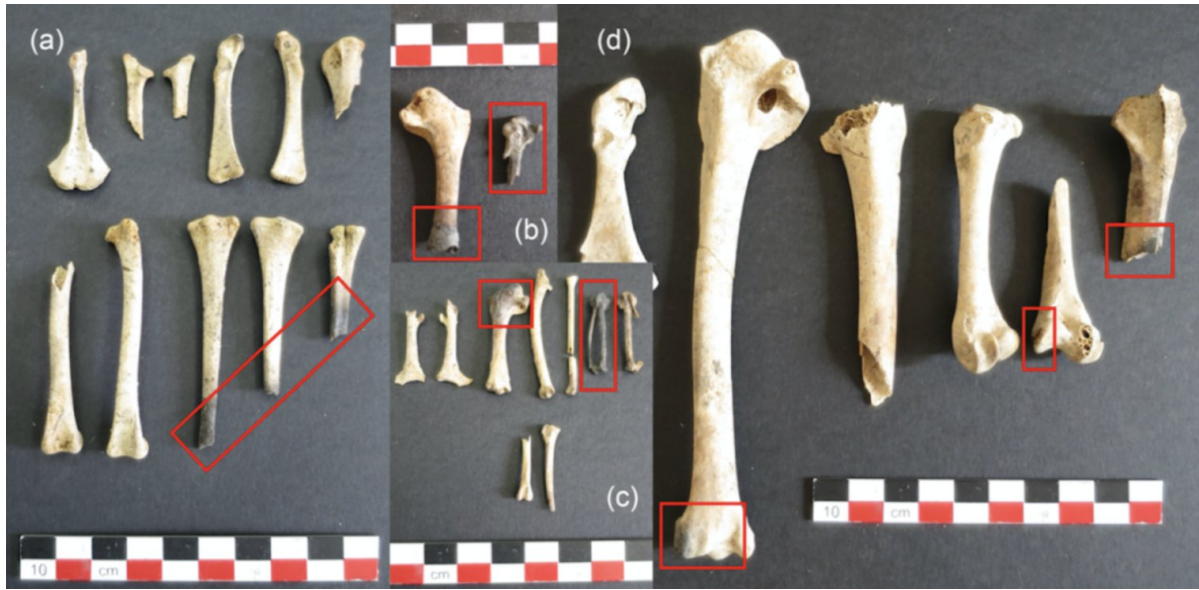
Рис 4. Рештки птахів, принесених у жертву в храмі Ісіді. Corbino C. A., Demarchi B. Birds for Isis: The evidence from Pompeii. International Journal of Osteoarchaeology , 2023.Vol. 33, No. 4. P. 767.