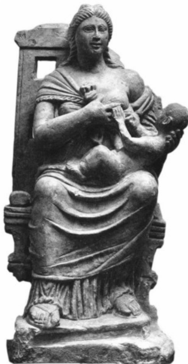
Рис 8. “Ісіда, що годує Гора” Higgins S. Divine Mothers: The Influence of Isis on the Virgin Mary in Egyptian Lactans-Iconograph. Journal of the Canadian Society for Coptic Studies, 2012. Т. 3. Р. 86.