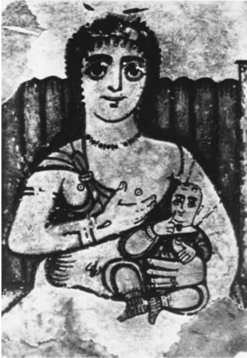
Рис 9. “Ісіда, що годує Гора” Higgins S. Divine Mothers: The Influence of Isis on the Virgin Mary in Egyptian Lactans-Iconography. Journal of the Canadian Society for Coptic Studies, 2012. Т. 3. Р. 86.