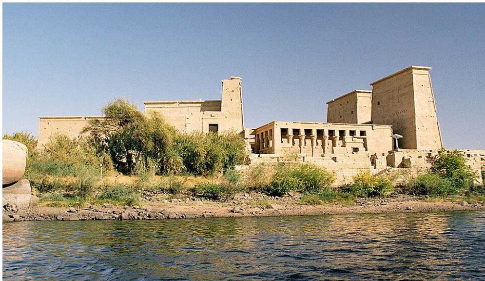
Рис 5. Храм Ісіді у Філах (Єгипет) URL: https://de.wikipedia.org/wiki/Tempel_von_Philae