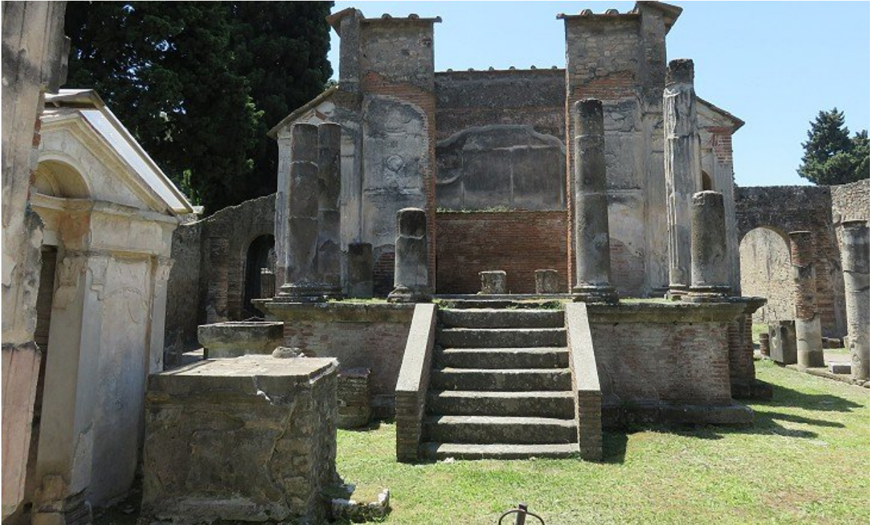
Рис 6. Храм Ісіон в Помпеях URL: https://www.romeartlover.it/Pompeii2.html