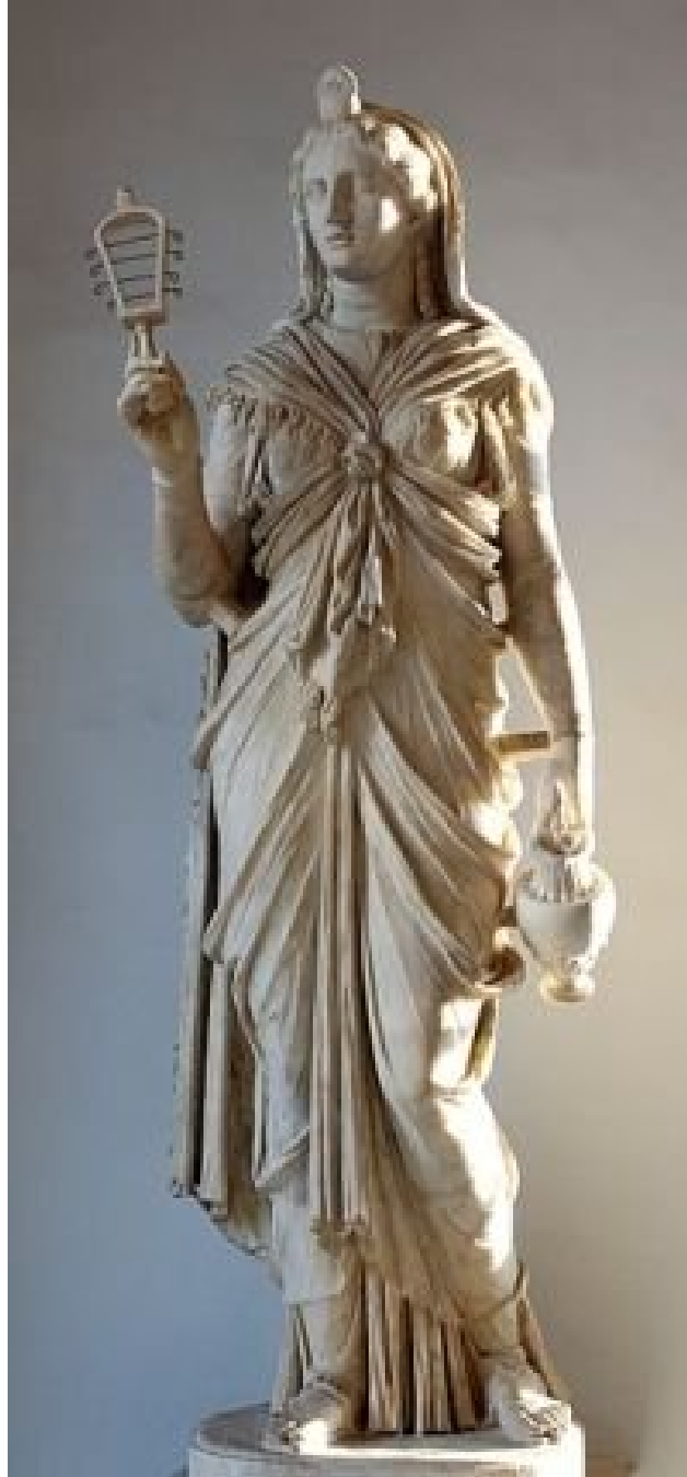
Рис. 3 Римська Ісіда тримає в руках ойнохо (посудину) і систрум (музичний інструмент), одягнена в характерний костюм з вузлом. Скульптура часів Адріана (117-138 рр. н.е.) URL: https://imperiumromanum.pl/en/roman-religion/gods-of-ancient-rome/list-of-roman-gods/isis/