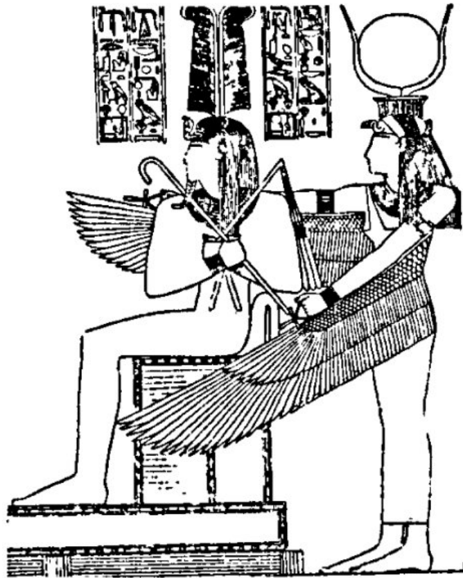
Рис 2. Ісіда стоїть позаду сидячого Осіріса з Абідоса. Akiko. Sugi. Semantics of New Kingdom iconography : a case study of the nh-symbol as a paradigm of understanding the interaction between pictorial metaphor and literary expression , Journal: University of Liverpool Repository, : 2023. P. 191.