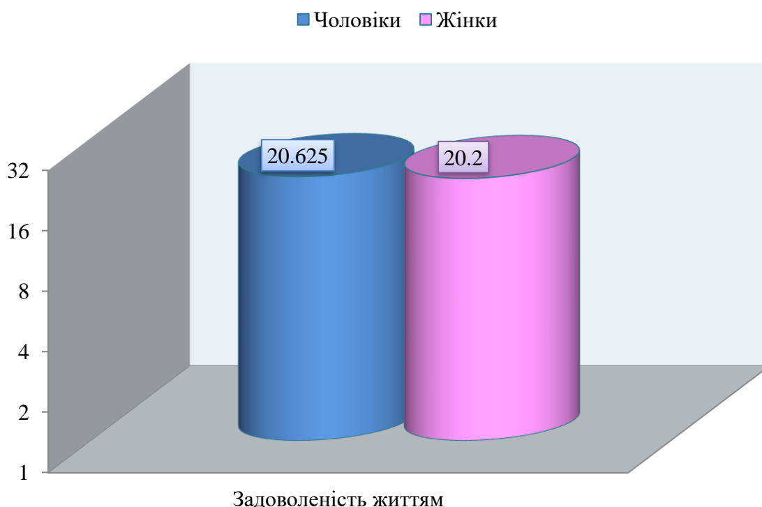
Рис.2.1. Результати дослідження рівня задоволеності життям молодих людей

Першими ми проаналізуємо результати дослідження дослідження рівня задоволеності життям у досліджуваних чоловіків та жінок молодого віку. Результати показані на рисунку 2.1.