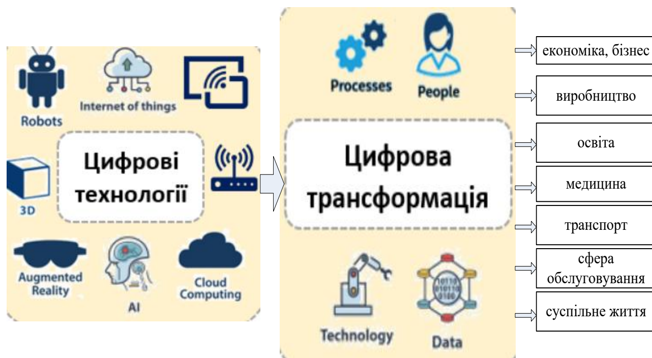
Рис. 1.5. Зміни внаслідок цифрової трансформації за галузями [19]