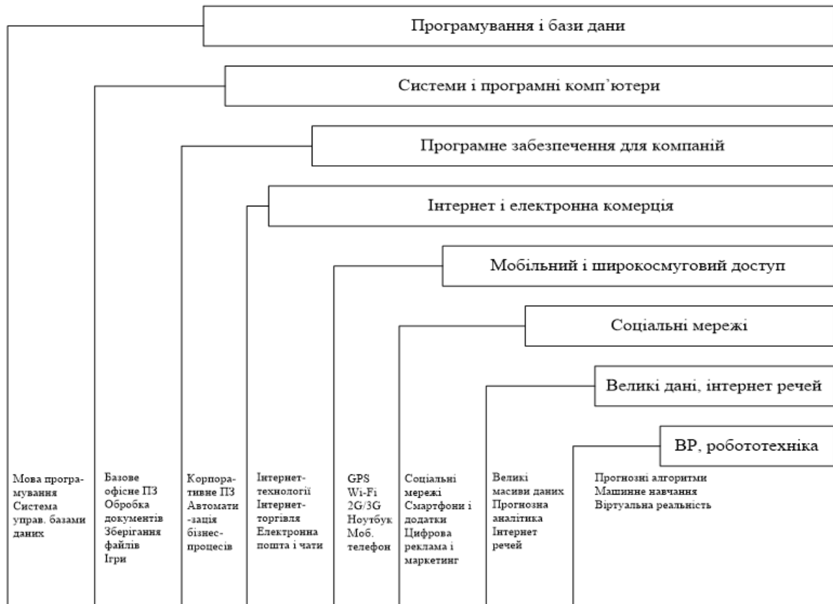
Рис. 1.2. Етапи становлення цифрової економіки під впливом технологічного прогресу

освіти, з позицій історичної ретроспективи дозволяє виявити закономірності, що часто залишаються поза увагою сучасних дослідників [9–10]. Аналіз еволюції цифровізації свідчить, що з розвитком технологій їх ефективність і економічна доцільність поступово зростали, значно перевершуючи можливості аналогових систем (рис. 1.2).