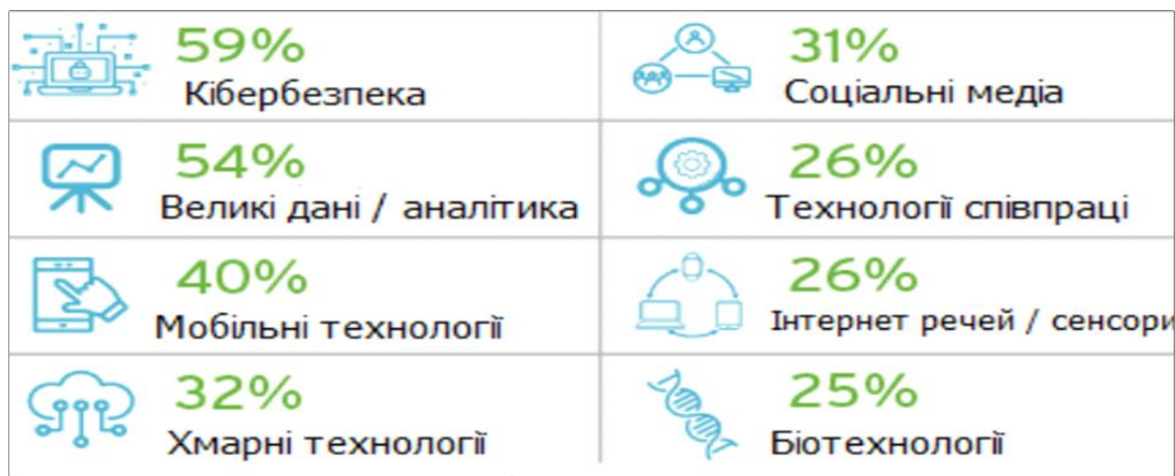
Рис. 1.4. Тенденції впливу цифрових технологій на сфери життєдіяльності [18]

таких галузях, як транспорт, фінанси, торгівля, виробництво, медицина й освіта. Для ЗП(ПТ)О «Харківський професійний коледж» це означає потребу у підготовці фахівців нової генерації, здатних працювати в умовах цифрової інтеграції та використовувати інноваційні інструменти у навчальному й професійному середовищі. Ці тенденції наочно відображено на рисунках 1.4-1.5, які демонструють вплив цифрових технологій на ключові сфери суспільного розвитку.