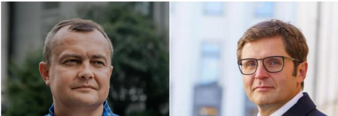
Рис. 2.1. Стаття: «Слуги» поза народом. Президентську фракцію охопила хвиля скандалів і гучних розслідувань: у чому викрили їх фігурантів.