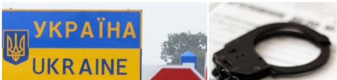
Рис. 2.4. Антикорупційна стаття на сайті ресурсу Obozrevatel