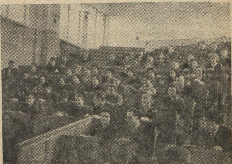
Добре слухати лекцію в такому чудовому приміщенні нової будови.

Лекції на семінарі читав А. Ю. Глауберман, професор Львівського університету, крупний спеціаліст в цій галузі. Він зробив у доступній формі огляд сучасних статистичних теорій електролітів. Особливу увагу приділив професор Глауберман досягненням радянських вчених, головним чином, школи М. Н. Боголюбова, у розробці цих питань. Лекції зацікавили студентів та викладачів, а також всіх тих, хто практично працює в цій галузі. Студенти дізналися не тільки про суть нової теорії, але ще раз переконалися у тому, як багато треба знати хіміку не тільки з хімії, але й з фізики, і з математики. І коли їм було іноді не все зрозуміло, на допомогу приходив лектор, який не лише пояснював всі математичні перетворення, але й нагадував, вчив думати.