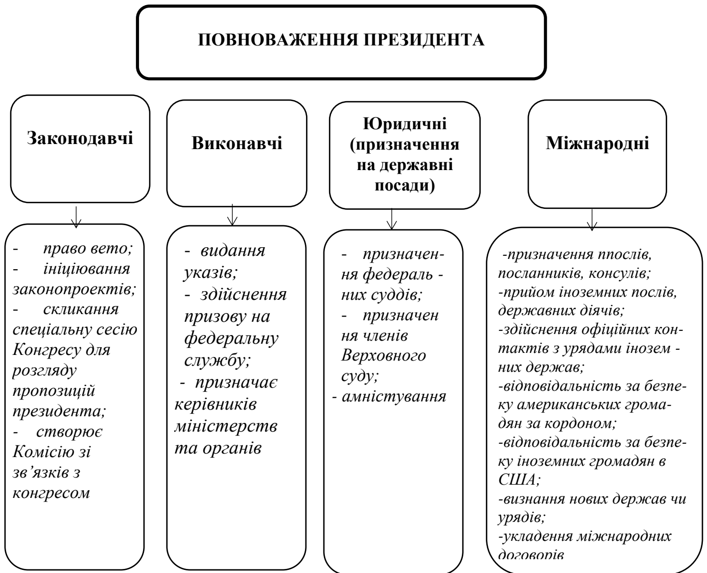
Рисунок 2.2 - Структура основних повноважень президента США у забезпеченні національної безпеки

3) З Конгресом Президент в цілому погоджує законодавчі акти.