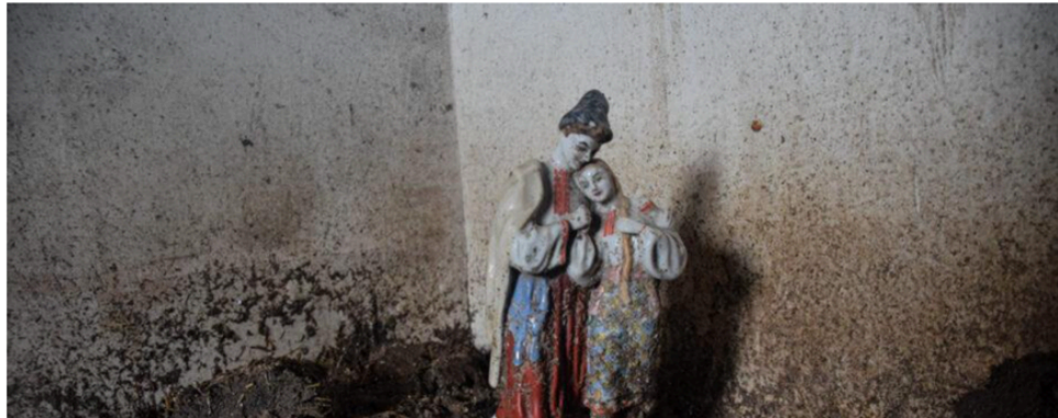
Рис. 2.1 Уривок з авторського довгочиту про військові злочини російських солдатів. Автор: Поліна Куліш, Гвара Медіа [96].

— Треба його забрати з собою, — Віктор підймає козака та обтирає його рукавом сорочки.