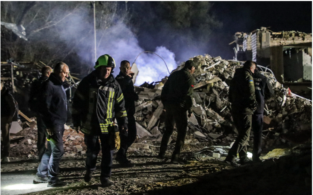
Рис. 2.3 Відеофіксація руйнування кафе після російського обстрілу села Гроза на Харківщині 5 жовтня 2023 року, в результаті теракту загинуло понад 50 людей. [70].

Наведемо приклад відеофіксації воєнного злочину в селі Гроза Куп'янського району (див. рис. 2.3).