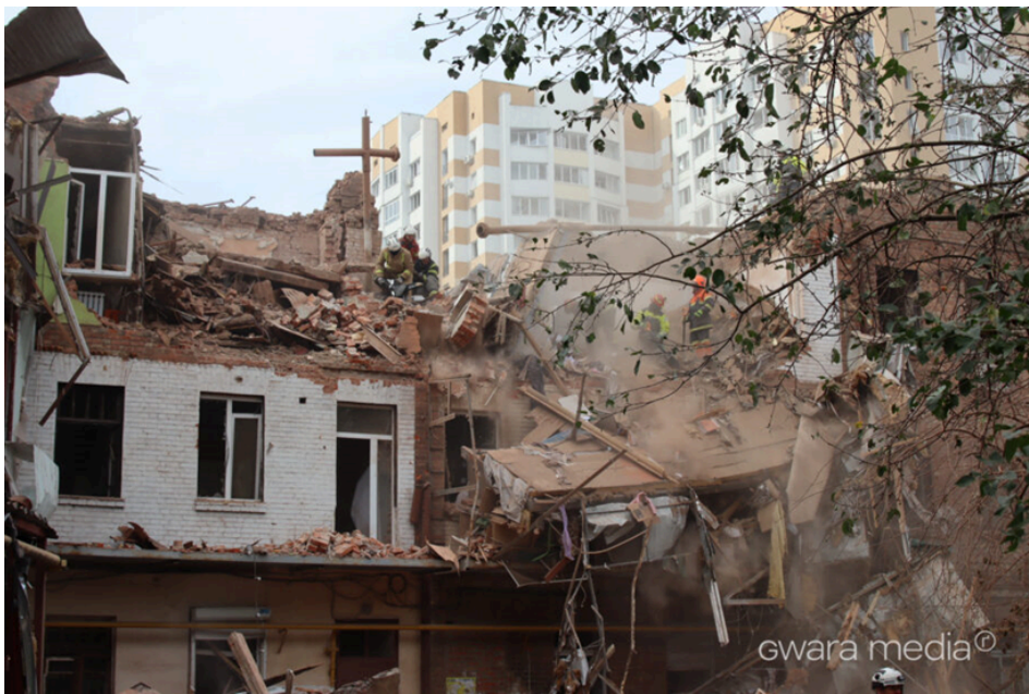
Рис. 2.2 Російська армія ударила ракетою типу «Іскандер» по житловому будинку в Харкові 6 жовтня 2023 року. Внаслідок цього загинуло дві людини. [102].

Наведемо такий приклад фотографії, що фіксує воєнні злочини: фото зруйнованого російською ракетою житлового будинку в Харкові (рис. 2.2).