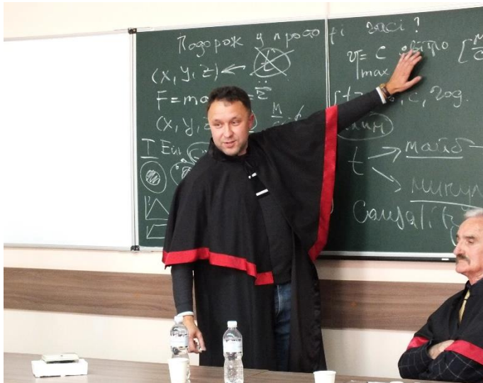
«Магія книги -магія науки, або один день з Альбертом Ейнштейном»