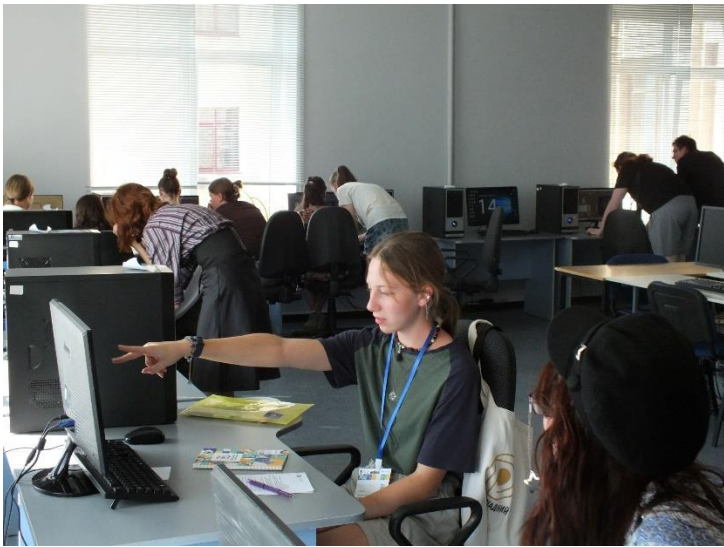
Міжнародний майстер-клас з фізики елементарних частинок.