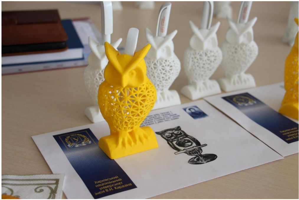
Конкурс «Бібліотекар року»