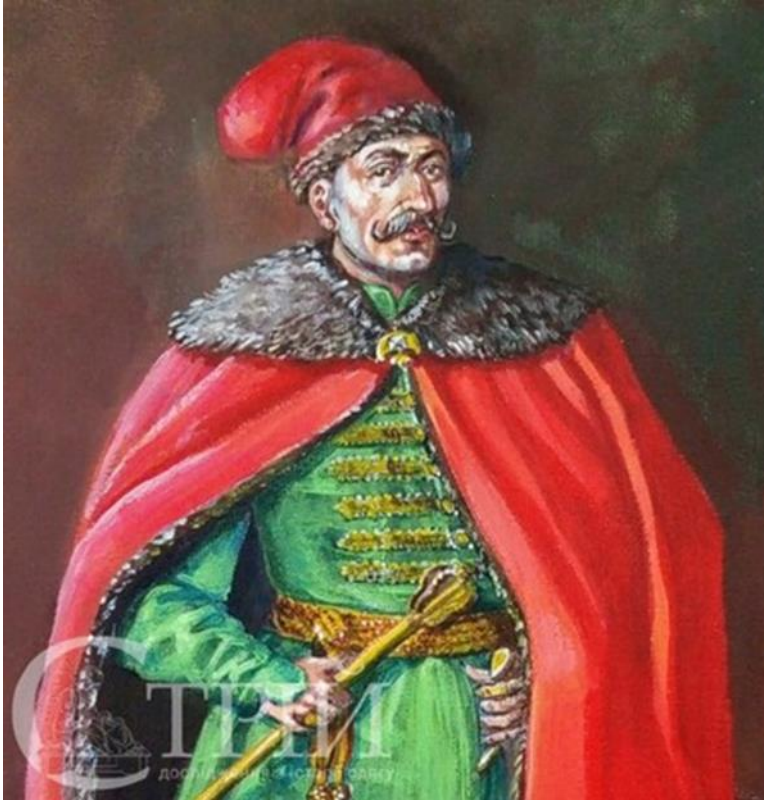
Полковник Григорій Гуляницький з Ніжинського полку, зображений на малюнку С. Шаменкова, діяв у 1650-ті роки.