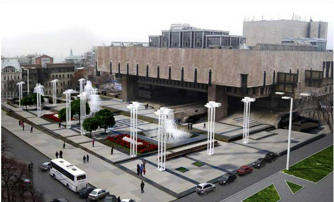
Рис. Харківський національний академічний театр опери та балету імені М. В. Лисенка

монструє новітні театральні тенденції, включаючи візуальний театр, пластичні перформанси та соціальний театр [129]. Харків вирізняється і тим, що є освітнім осередком театального мистецтва: тут розташований Харківський національний університет мистецтв, де готують акторів, режисерів і театрознавців.