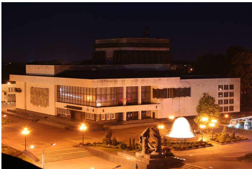
Рис. Івано-Франківський національний академічний драматичний театр імені Івана Франка

Окремо варто згадати Івано-Франківськ, де функціонує Івано-Франківський національний академічний драматичний театр імені Івана Франка, знаний експериментальними постановками. Його команда реалізовує проекти, що поєднують локальну ідентичність із сучасними європейськими тенденціями (наприклад, вистава "Нація" за творами Марії Матіос).