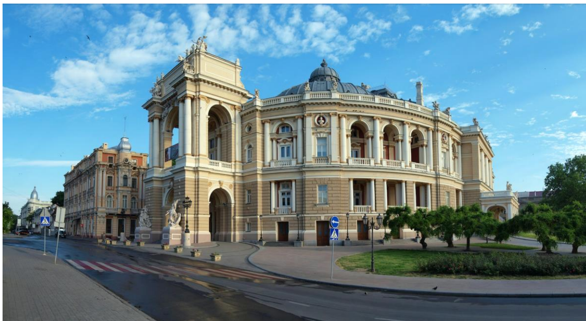
Рис. Одеський національний академічний театр опери та балету

Окремо варто згадати Івано-Франківськ, де функціонує Івано-Франківський національний академічний драматичний театр імені Івана Франка, знаний експериментальними постановками. Його команда реалізовує проекти, що поєднують локальну ідентичність із сучасними європейськими тенденціями (наприклад, вистава "Нація" за творами Марії Матіос).