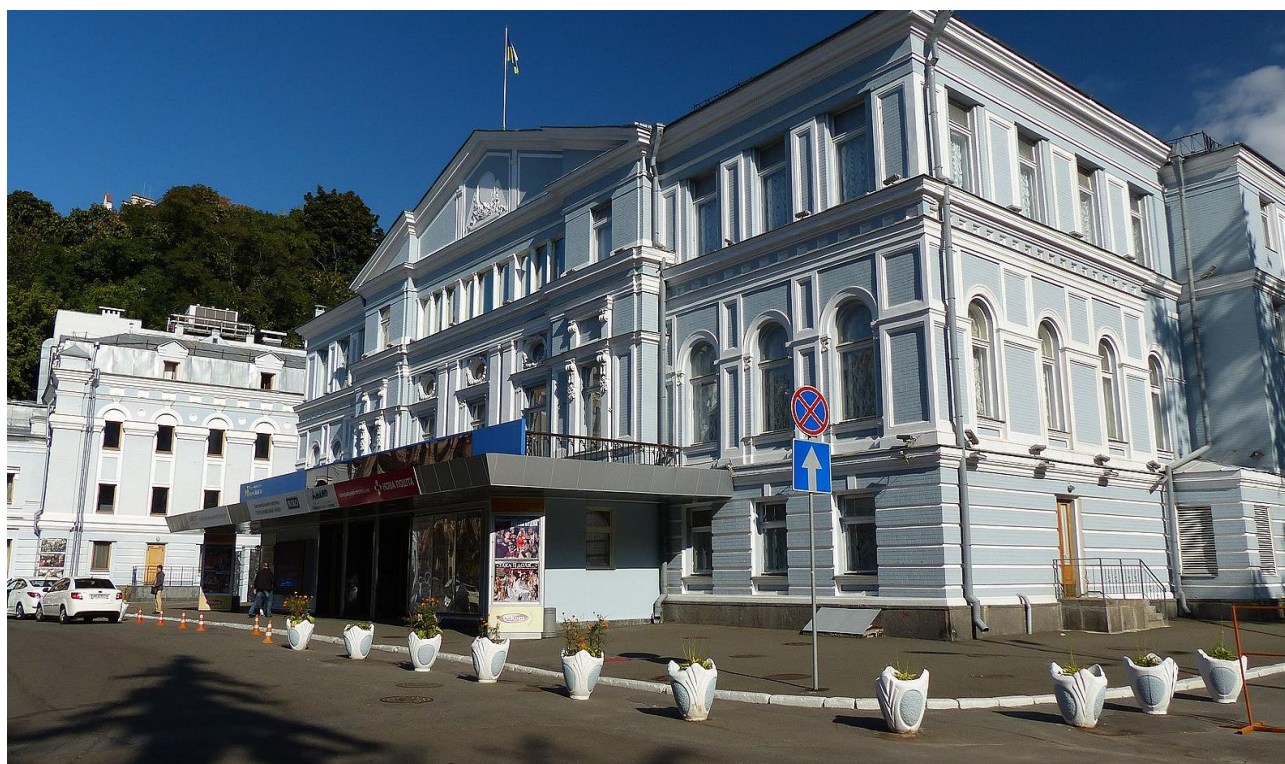
Рис. Національний академічний драматичний театр імені Івана Франка

Київ – столиця України – є безумовним флагманом у сфері театрального туризму. Тут зосереджено найбільшу кількість державних і незалежних театрів, серед яких Національний академічний драматичний театр імені Івана Франка, Національний театр опери та балету України імені Тараса Шевченка, Театр на Подолі, Центр Сучасного Мистецтва «ДАХ» та інші. Київ також є майданчиком проведення найвідоміших театральних фестивалів, зокрема ГогольFest, який поєднує театральне мистецтво з музикою, візуальними інсталяціями та урбаністикою. Театральні події в столиці приваблюють як українських глядачів, так і іноземців, створюючи ґрунт для культурної дипломатії. Завдяки великій кількості театральних закладів, розвитку інфраструктури, а також наявності альтернативних сцен, Київ формує комплексний туристичний продукт, в якому театр відіграє центральну роль [73].