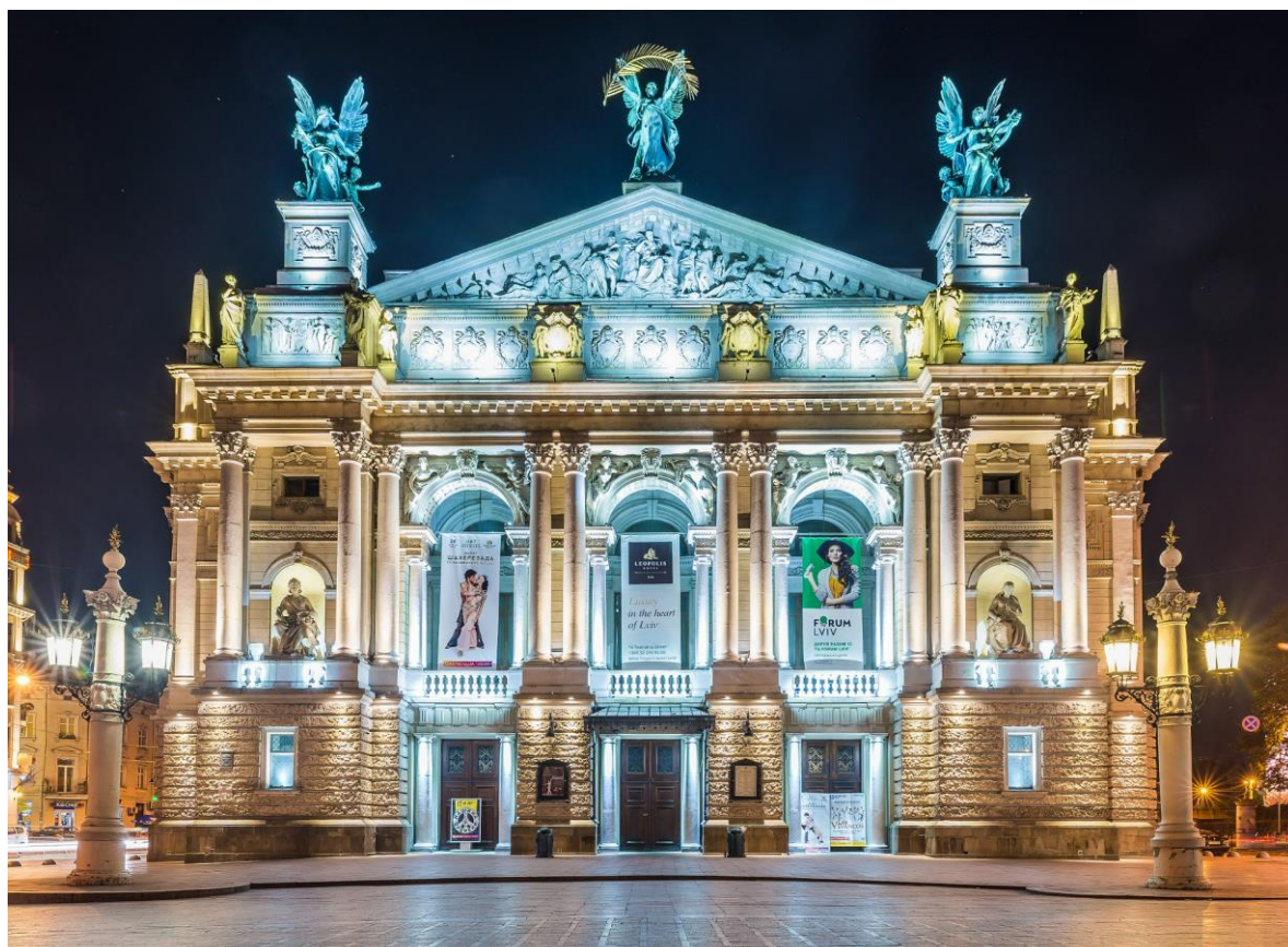
Рис. Львівський національний академічний театр опери та балету імені Соломії Крушельницької

класичної української драми. Крім того, Львівський театр опери та балету славиться архітектурною вишуканістю та насиченим репертуаром. Особливістю театрального Львова є інтеграція театру в міський простір, проведення фестивалів, таких як Золотий лев, що включає вуличні вистави, перформанси та постановки під відкритим небом. Львів перетворюється на "місто-театр", що приваблює культурних туристів з Польщі, Німеччини, Чехії, Словаччини та інших країн.