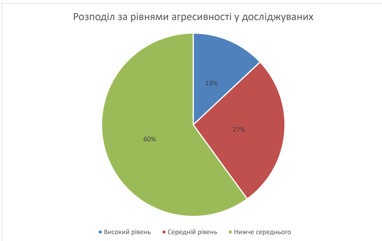
Рис. 2.1. Відсотковий розподіл за рівнями агресивності у вибірці досліджуваних.

Для наочності на Рис. 2.1. наводимо загальний розподіл вибірки дослідження за рівнями агресивності.