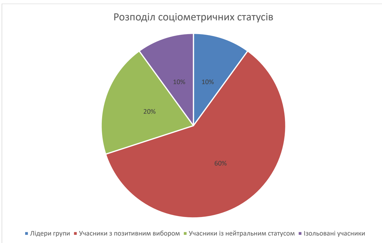
Рис. 2.3. Розподіл соціометричних статусів серед учасників досліджуваної групи молодших підлітків.

Наочно результати дослідження щодо розподілу соціометричних статусів представлено на Рис. 2.3.