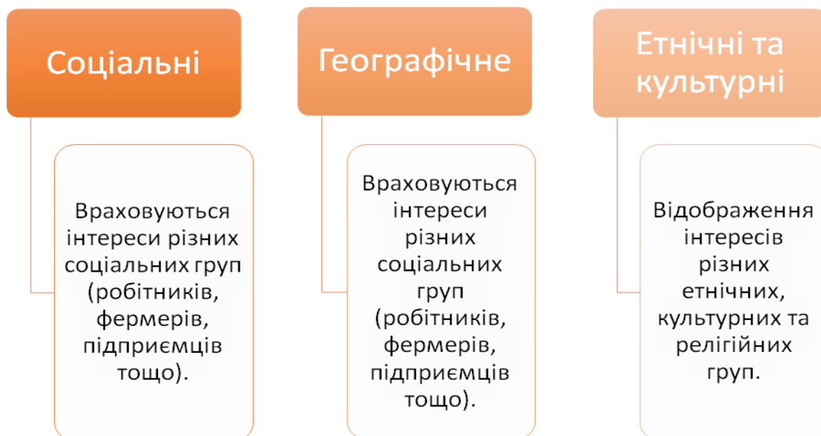
Рис. 1.1. Представництво інтересів громадян.

законодавчій і політичній сферах. Парламент складається з депутатів, які обираються народом або призначаються для представлення інтересів різних груп населення. Це дозволяє включити до політичного процесу широкий спектр поглядів та інтересів (рис. 1.1).