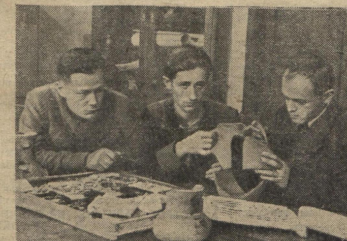
Серед студентів історичного факультету великою популярністю користується гурток археології. На фото: гуртківці у археологічному музеї.

Харківська група Діпровузу закінчила розробку перед-проекту майбутньої будівлі Харківського державного університету імені О. М. Горького, який за рішенням Ради Міністрів Союзу РСР розміститься в колишньому Будинку проєктів.