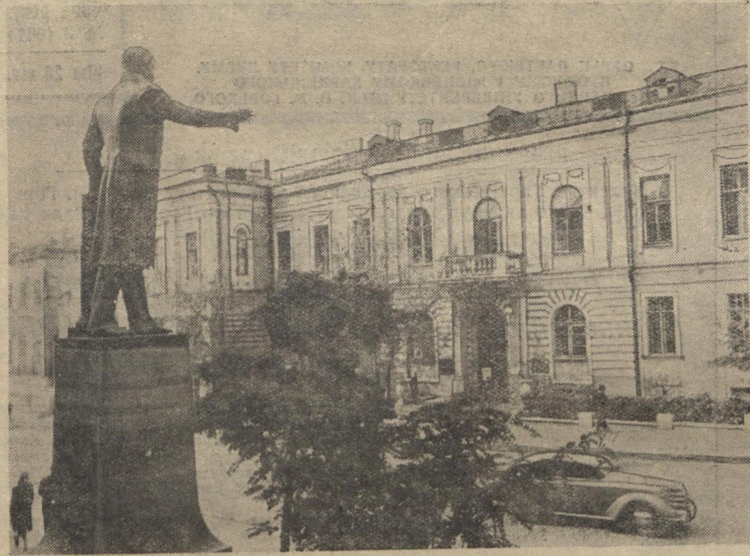
Біля входу до головного корпусу університету — меморіальні дошки. Зліва читаємо: «Тут учився великий вчений Ілля Ілліч Мечніков 1862—1864». Справа — «Місце барикад першого штурму, де 11—24 жовтня 1905 року під керівництвом пролетаріату революційне студентство пліч-о-пліч з робітниками билося проти царів».

Старіший на Україні Харківський державний університет ім. Горького засновано у 1805 році.