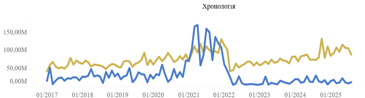
Рис. 2. Хронологія експортно-імпортних операцій між Україною та країнами Латинської Америки за 2017-2025 рр. (за даними Дія.Бізнес) [45]

До війни торгівля між Україною та Латинською Америкою була відносно скромною, але стратегічно важливою. Україна експортувала сільськогосподарську продукцію, таку як зерно, соняшникова олія та добрива, імпортуючи латиноамериканські товари, включаючи каву, яловичину та тропічні фрукти. Війна порушила ці потоки, завдавши шкоди виробничим потужностям України та обмеживши доступ до Чорного моря, що спричинило світове зростання цін на зерно та добрива. Латиноамериканські держави були серед регіонів, які постраждали від цих збоїв, як імпортери українського зерна, так і конкуренти на світових сільськогосподарських ринках. Бразилія, Аргентина та Парагвай — основні експортери сільськогосподарської продукції — відчували підвищений попит на власну зернову та добривну продукцію, оскільки український експорт скоротився, що дозволило їм захопити більшу частку ринку в Африці та Азії. Водночас зростання цін на добрива, частково спричинене західними санкціями проти Росії та Білорусі, змусило такі країни, як Бразилія, шукати альтернативних постачальників, включаючи Україну, де це можливо, хоча сама Україна зіткнулася з виробничими труднощами [56, с. 61].