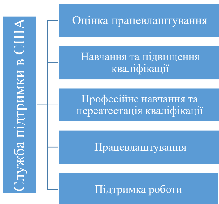
Рисунок 2.1 Зосередженість служб підтримки в США

Програма служби підтримки біженців також усуває такі перешкоди для працевлаштування, як: